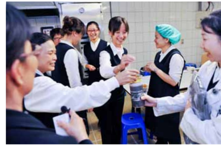
■ 營養師與廚師等同仁們將零錢投入竹筒，期許民衆珍惜餐桌上的每一口食物。