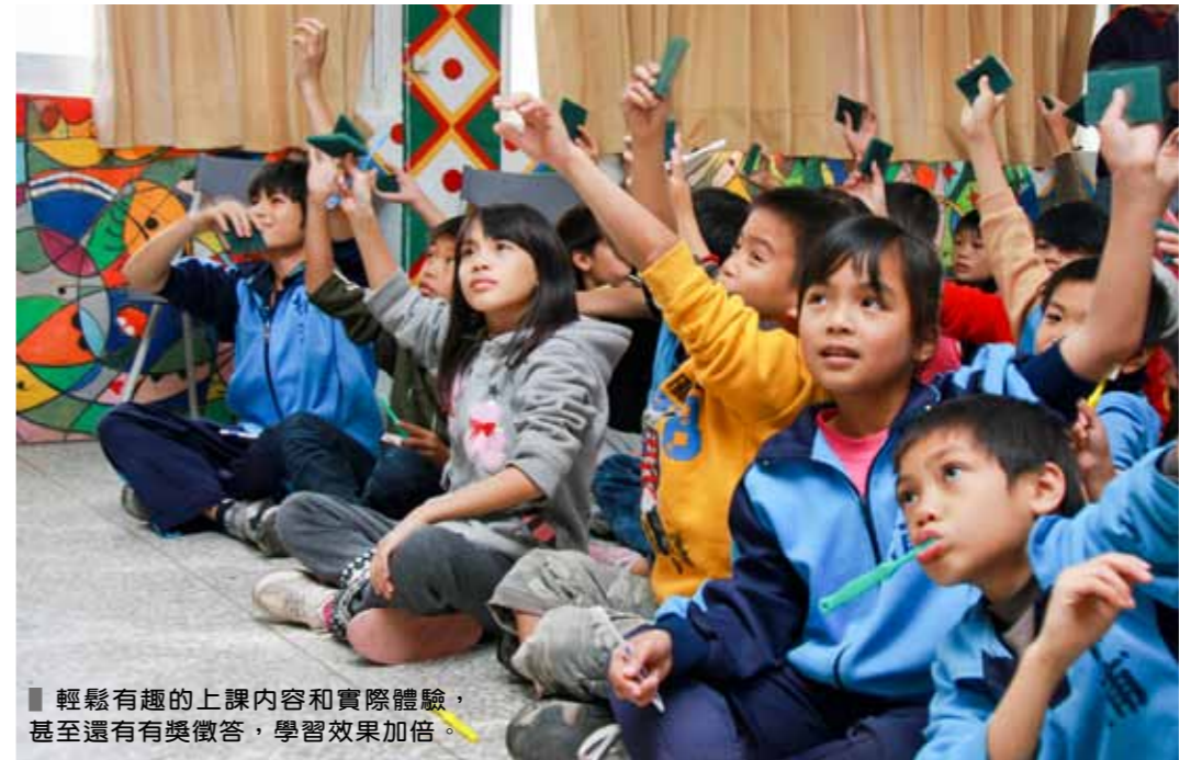
輕鬆有趣的上課內容和實際體驗，甚至還有有獎徵答，學習效果加倍。