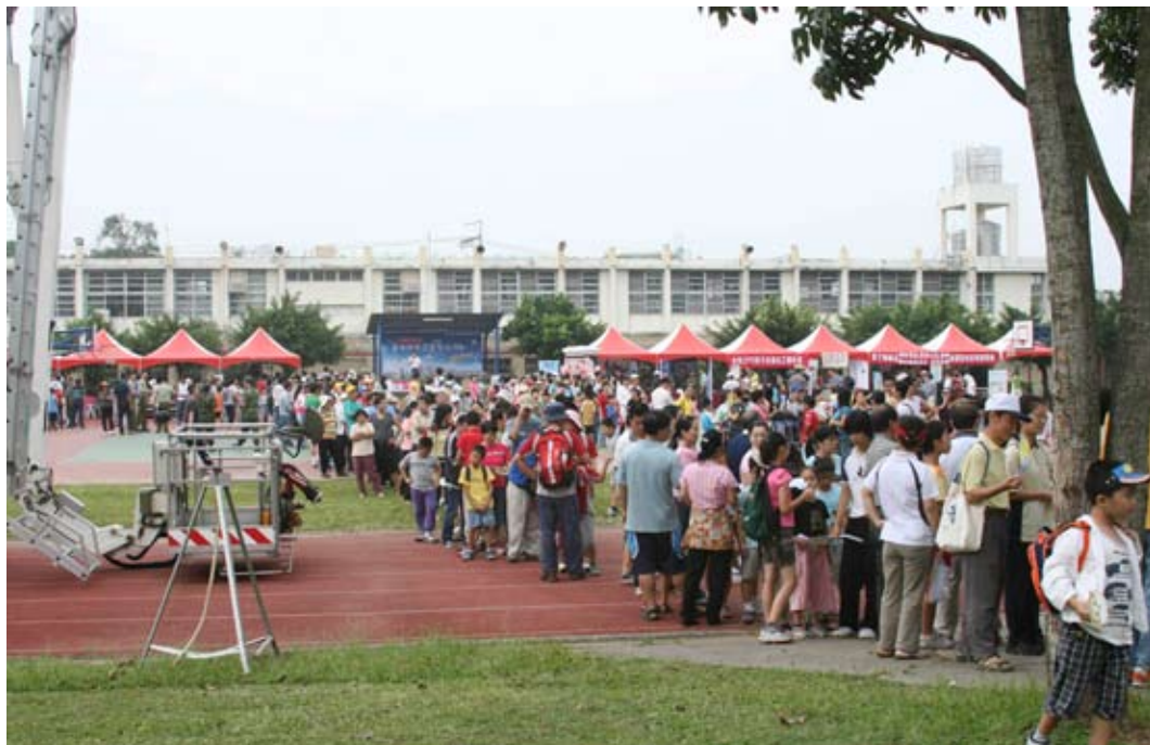
■ 臺中縣在全國登山日舉辦大型活動，以預防醫學看健康為目標的臺中慈院沒有缺席，利用這個機會幫民衆作健檢。

臺中慈院社區健康中心維護鄉親健康克盡心力，四日發動預防醫學志工，一起前往潭子鄉新興國小，幫參加「全國登山日」的臺中縣民作健檢，透過量腰圍、測骨質密度數據，了解身體狀況，