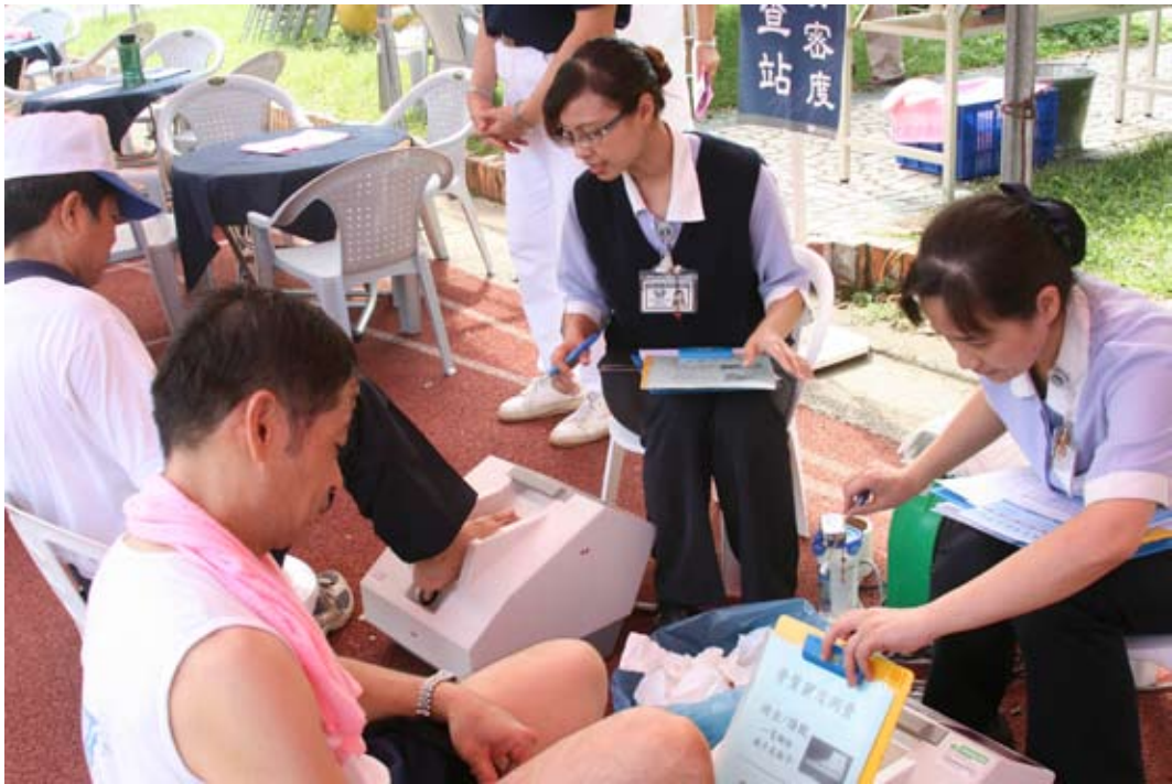
■ 臺中慈院社區健康中心幫早起運動的民眾測量骨質密度，讓民眾能夠掌握自己的骨本，也趁機推廣多運動促進骨質密度的好處。