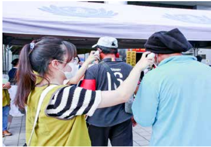
頂著高溫炎熱，志工在外場帳篷區先為就醫的漁工朋友量體溫、酒精消毒手、掛上號碼牌，再引導至報到區。