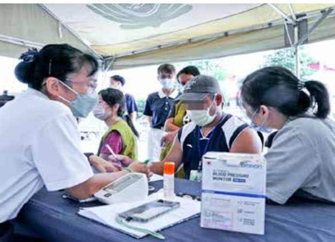
報到區進行量血壓與填表，翻譯志工從旁協助解說。