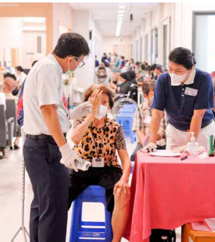
義診前篩檢安排於五月二十日，病人在印尼慈院的健保門診區接受檢查。