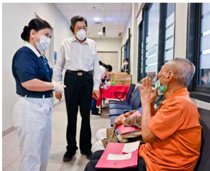
義診上印尼慈院謝源生院長與志工關懷病家。