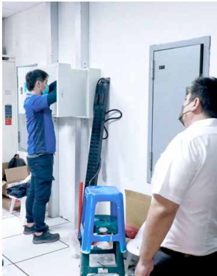
總務室同仁搬運物資（左圖），資訊室同仁處理資訊主機電源架設（右圖）。支援的同仁無不傾力好讓三義中醫醫院能順利啟業。