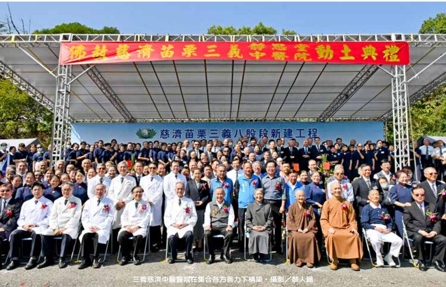
三義慈濟中醫醫院在集合各方善力下構築。

預計設立中醫內科、中醫兒科、中醫婦科、中醫傷科、中醫針灸科等門診，期可滿足鄉親在慢性病診療、中醫調養、長期照顧及樂活養生等多元層面需求，也將設置住院病床十床。