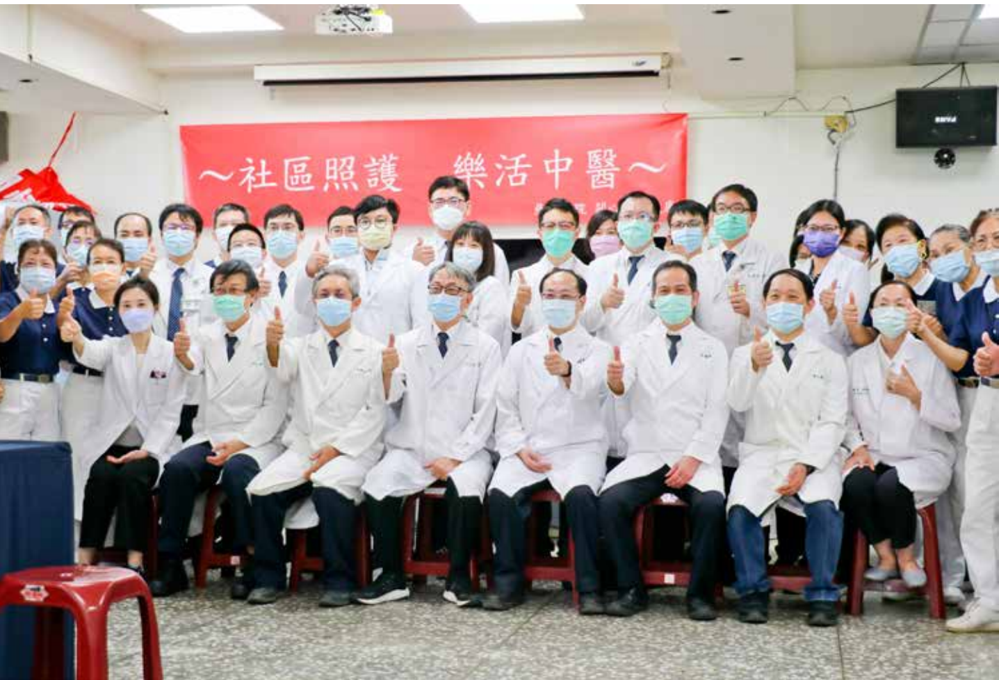
臺中及大林慈濟醫院中醫團隊結合在地志工逾百人合力圓滿任務。

三義中醫醫院即將啟用，已然在地方成為重要消息。七十五歲的江女士搶頭香，一早騎車十分鐘的路程到義診地點等待。她說以前都去臺中慈院看診，很期待三義慈濟中醫醫院成立，對大家更方便。