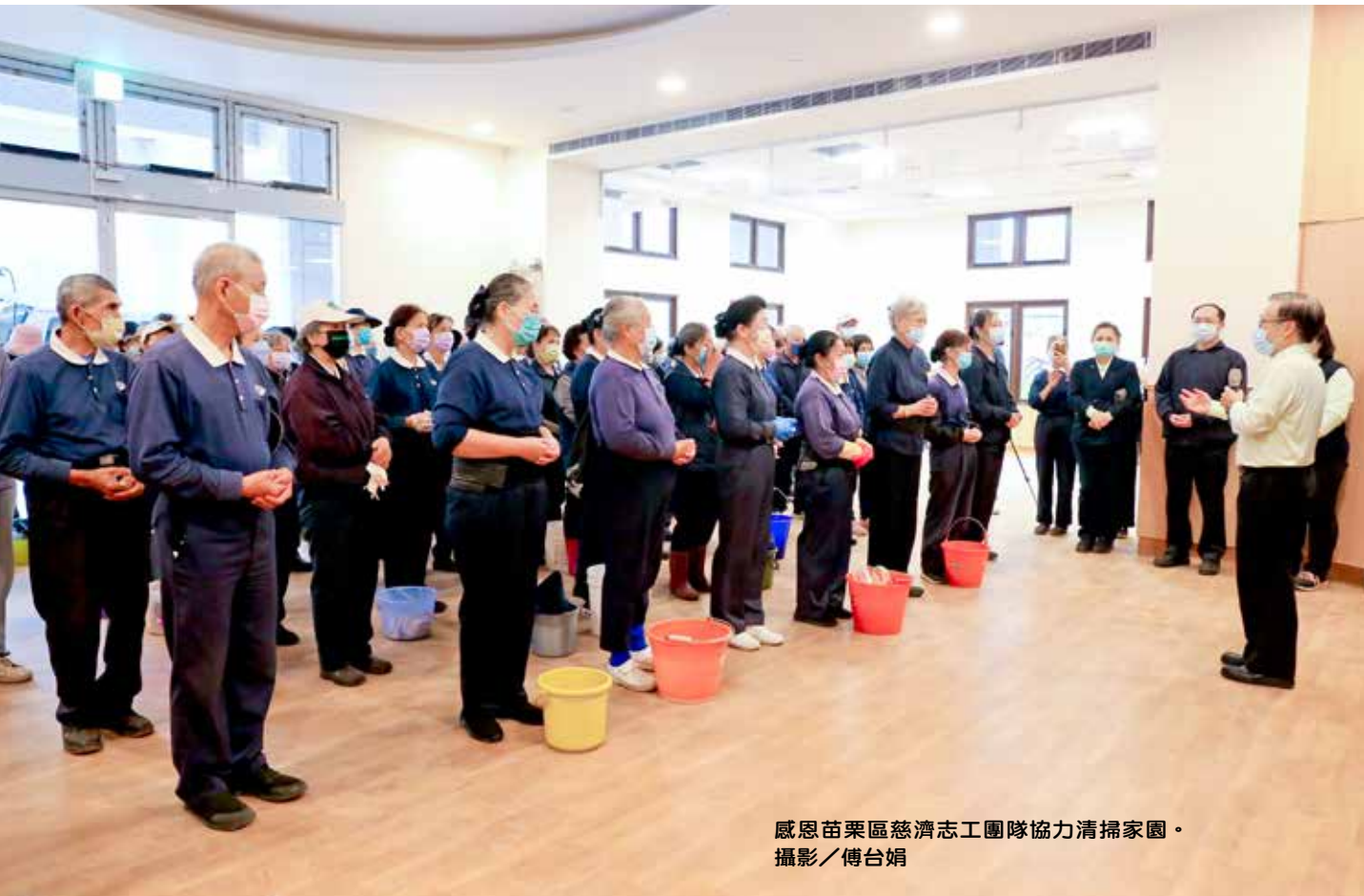
感恩苗栗區慈濟志工團隊協力清掃家園。