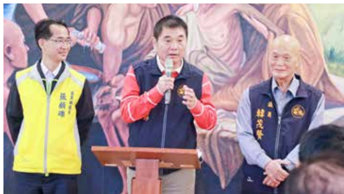
徐耀昌縣長（左圖中）、苗栗縣議長暨準縣長鍾東錦（右圖中），感謝慈濟醫療資源挹注造福鄉親。