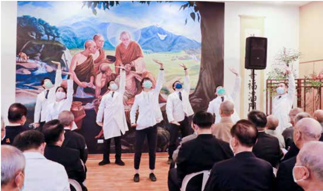
臺中慈院中醫部醫師群以八段錦演示為鄉親帶動養生保健。

下，三義慈濟中醫醫院落成啟用，也補足了苗南地區的醫療資源。苗栗縣議長暨準縣長鍾東錦感謝慈濟醫療資源投入苗栗，希望將來引發共善效應。