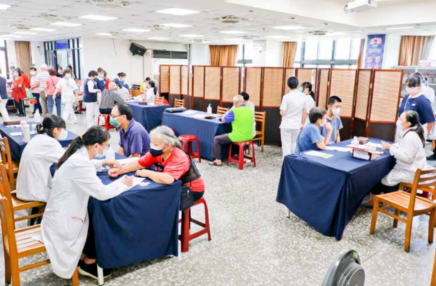
二〇二二年九月十八日大林慈院與臺中慈院中醫部的醫護團隊在苗栗縣三義鄉立圖書館舉辦大型義診，現場提供把脈、問診與針傷治療。