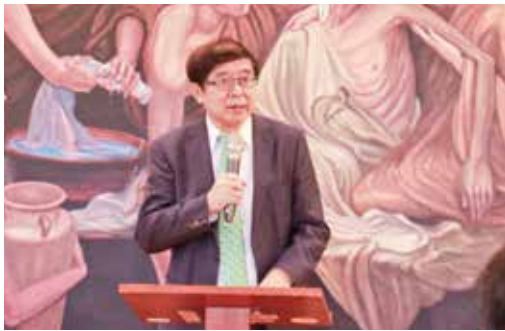
衛福部健保署長李伯璋感恩慈濟對臺灣醫療的貢獻。

慈濟靜思精舍德勤法師代為宣讀證嚴法師賀辭，感恩苗栗縣府團隊、慈濟人與醫療團隊完成中醫醫院設置。未來將持續推動中西醫合療，成為全方位的中醫醫院。證嚴法師表示，中醫強調上醫治未病，將來會與慈善、教育、人文等志業攜手，共同守護苗栗鄉親身心健康。他祈願，醫護菩薩妙法妙手妙人醫