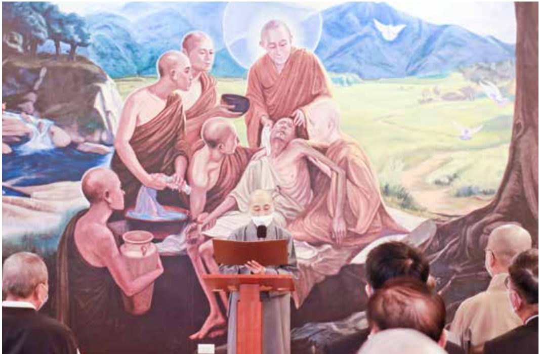
慈濟靜思精舍德勤法師代為宣讀證嚴法師賀辭，感恩苗栗縣府團隊、慈濟人與醫療團隊完成中醫醫院設置。