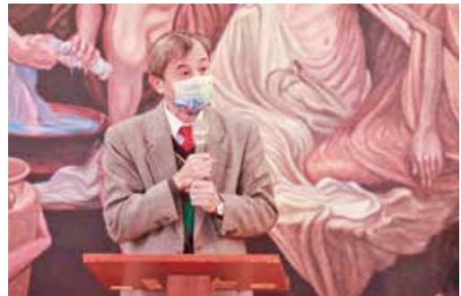
衛福部中醫藥司長黃怡超肯定慈濟以中醫為基礎設置三義慈濟中醫醫院，造福三義鄉親。

慈濟靜思精舍德勤法師代為宣讀證嚴法師賀辭，感恩苗栗縣府團隊、慈濟人與醫療團隊完成中醫醫院設置。未來將持續推動中西醫合療，成為全方位的中醫醫院。證嚴法師表示，中醫強調上醫治未病，將來會與慈善、教育、人文等志業攜手，共同守護苗栗鄉親身心健康。他祈願，醫護菩薩妙法妙手妙人醫