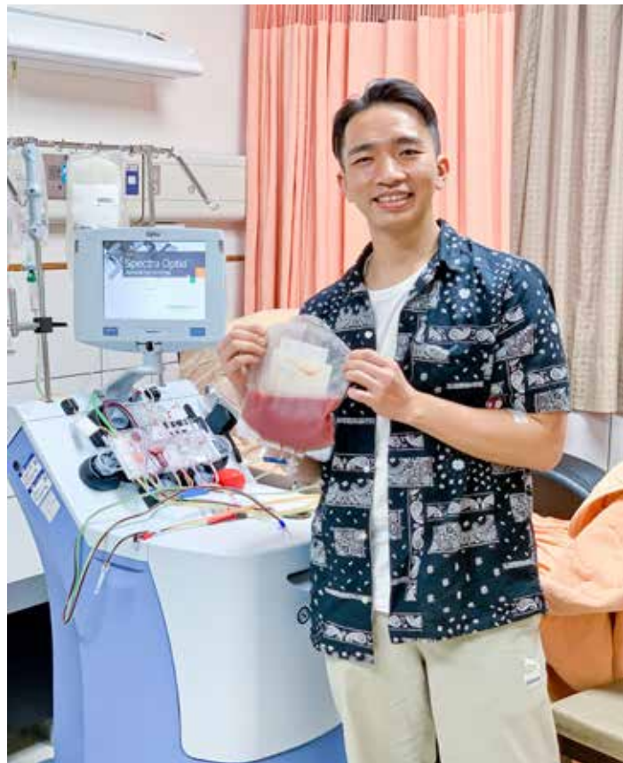
鑑識科巡官小吉經常出入各種意外的生命現場，這一次同樣是生命現場，他可以逆轉生死，給別人重生的機會。圖為捐贈完成，拿著自己的血袋留影。

「我是鑑識巡官，所以我常常會看到生死的現場，當我在工作時，看到的都是已經木已成舟的事情，就是已經死亡。那個時候，在我工作是比較被動的狀態，我沒有辦法去改變什麼，因為事情已經是這樣子了，我只能就現場的狀況去為死者發聲，死亡這件事情是既定事實，我沒有辦法去主動改變什麼。」