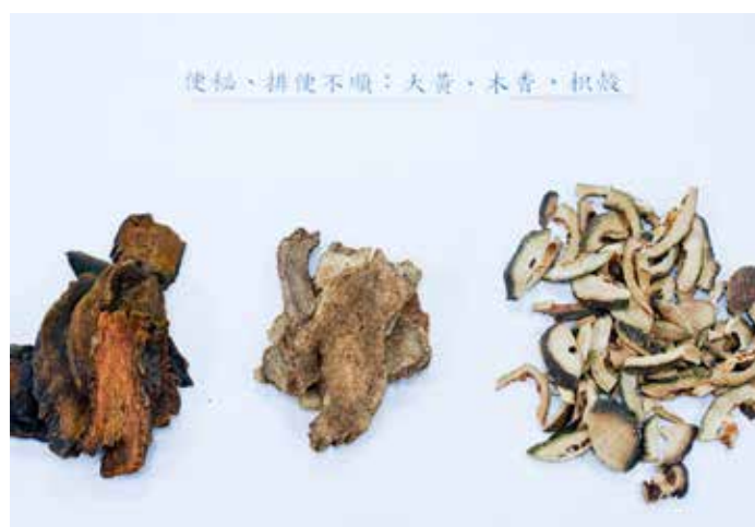
便秘、排便不順可用大黃、木香、枳殼緩解。