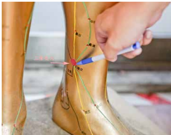
足部的「三陰交」穴，內踝高點上三寸，脛骨內側面後緣，貼近脛骨取穴，可治一切婦科疾患。