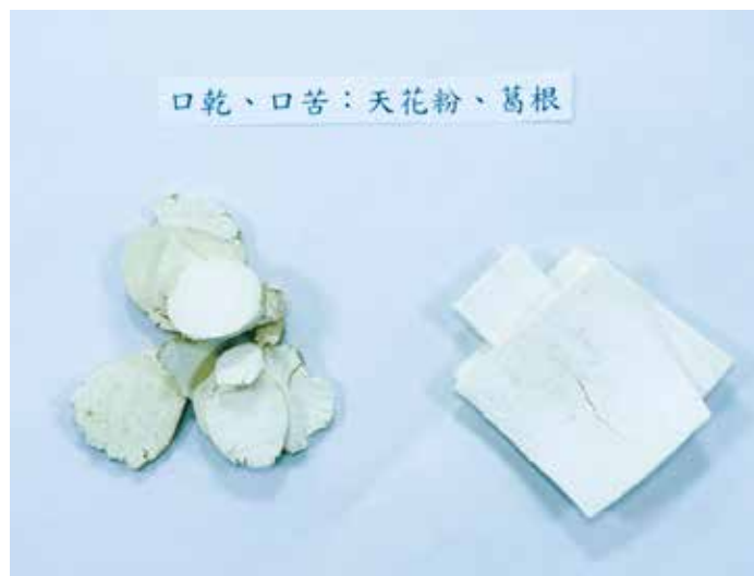
口乾口苦可用天花粉、葛根緩解。