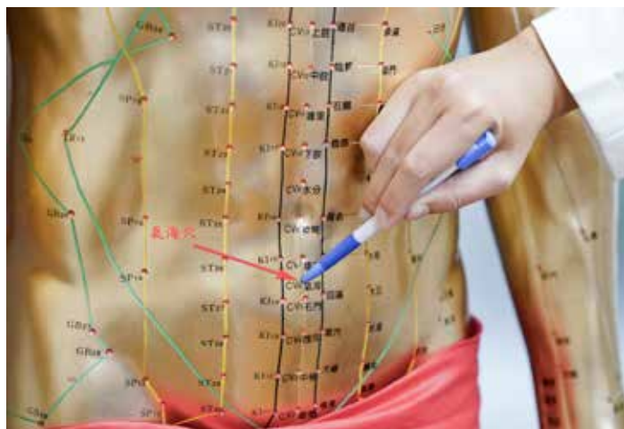
腹部的「氣海」穴，位於肚臍下方約一寸半，有理氣、益氣功效，對於腹脹、腹瀉、便秘、痛經有緩解功效。

主任說，病友除了持續依照新陳代謝科醫師醫囑服用降血糖藥或注射胰島素控制血糖之外，中藥與針灸可以改善緩解糖尿病併發症。例如疲倦可用玉竹、黨參；失眠可用夜交藤、茯神、酸棗仁；便秘、排便不順可用大黃、木香、枳殼；