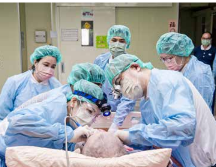
人醫成員攜手合作，為每一床院民洗牙。