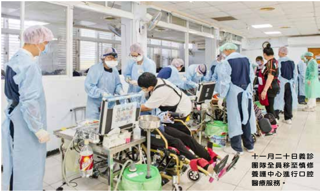
十一月二十日義診 團隊全員移至慎修 養護中心進行口腔 醫療服務。