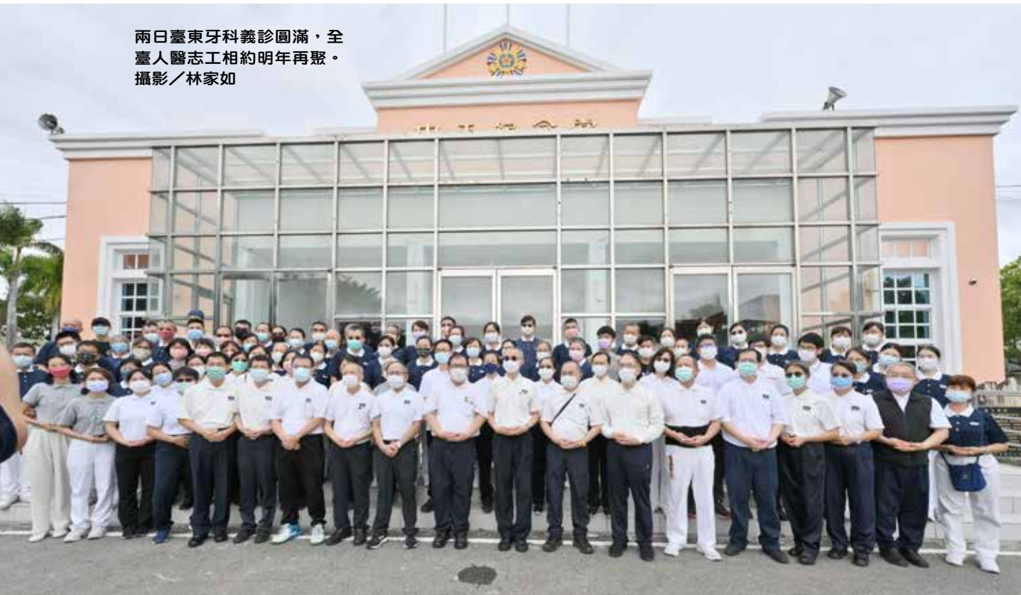
兩日臺東牙科義診圓滿，全 臺人醫志工相約明年再聚。