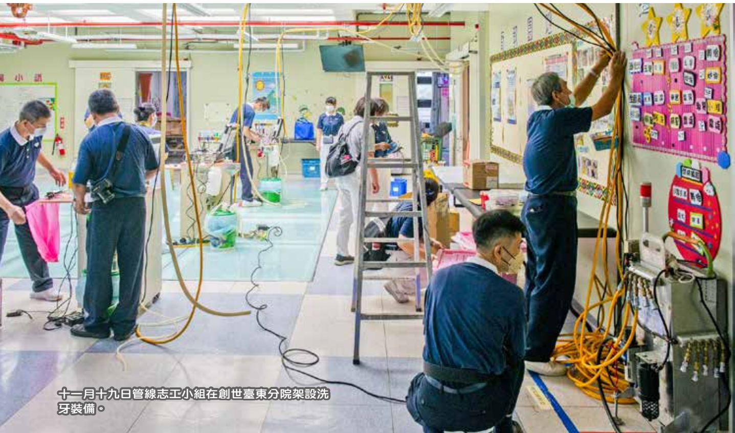
十一月十九日管線志工小組在創世臺東分院架設洗牙裝備。

一個接一個的看診，每一床幾乎要六個人同時協助，每一床至少要花上二十分鐘以上；半天下來，不只是醫師腰痠背痛，牙科助理與護理師也頻頻地利用空檔做伸展動作，緩和疲憊的身軀，而身上的汗水早已沿著身軀透濕了衣服，簡式隔離衣濕答答的黏在皮膚上……但是每個人依然全神貫注服務病人。時至傍晚，診療結束後，管線志工們再次上場，拆卸下所有醫