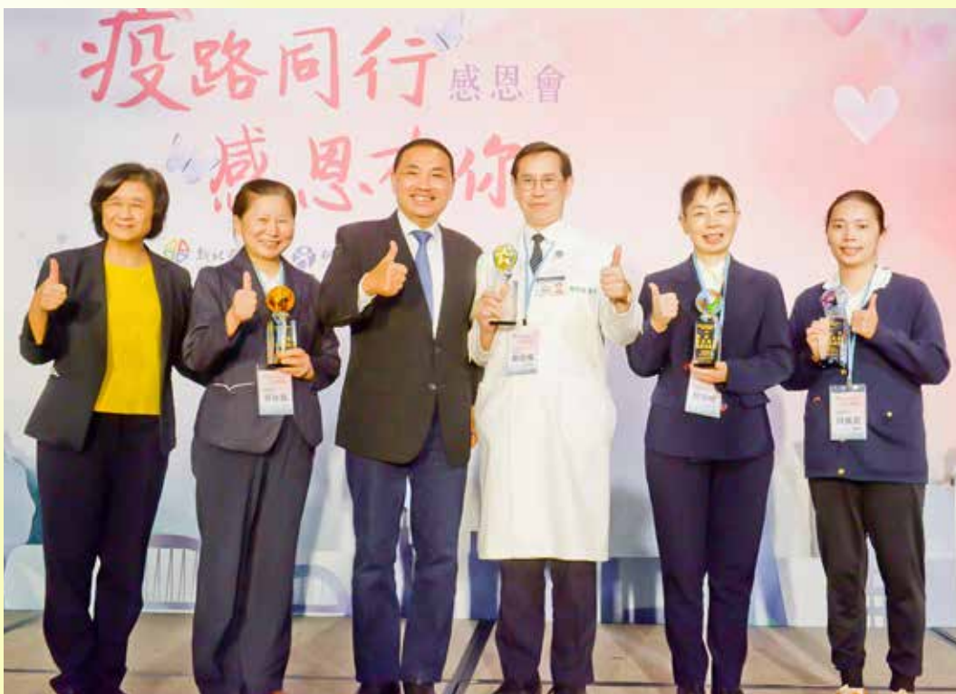
臺北慈濟醫院防疫卓越，從新北市長侯友宜手中接過獎座。