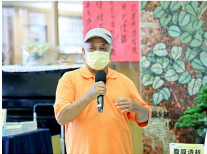
韓先生開心分享，使用「全自動腹膜透析 (APD)」後，重拾愉悅的日常生活。

任分享，《全彩圖解腹膜透析居家照顧全書》分成七大主題，針對認識腎臟及腎臟病、善用醫病共享決策、腹膜透析介紹、健康管理、日常照護需知、例常運作與調適、善用雲端科技輔助照護等面面俱到的內容外，還特別附上影音示範教學QR Code，可透過影音教學平臺，無限次觀看由護理師親自示範影像，來同步操作練習，除了國語版本教學，還有臺語、英文及印尼語版本可以選擇，讓讀者能詳細了解腹膜透析相關的操作與衛教知識，進而減輕壓力及負擔，實踐追求健康的生活。