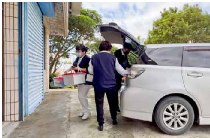
團隊才剛抵達明里村社區活動中心，就有鄉親主動掃地，也幫忙場地布置。