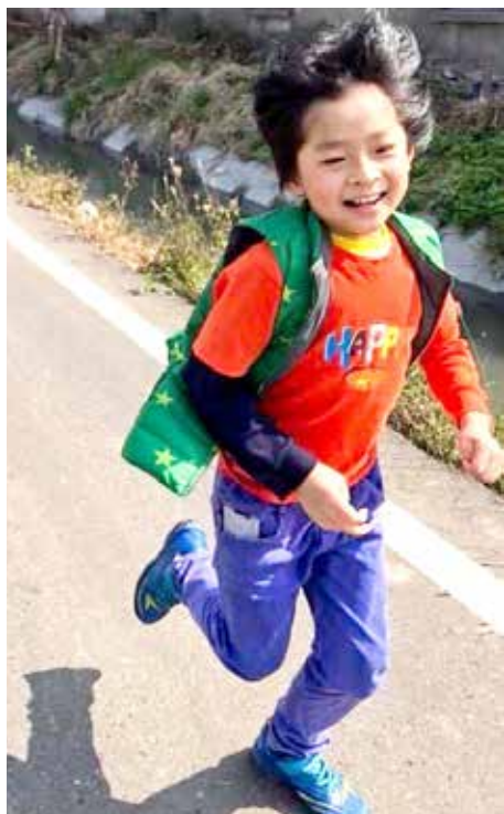
移植出院後，媽媽最開心的就是看到秉辰可以在陽光下奔跑，在戶外自由自在的玩耍。更高興兒子健康成長。