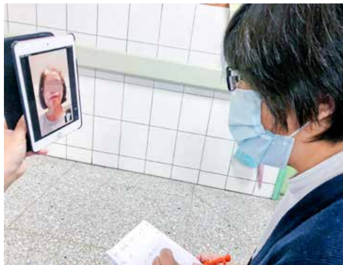
新陳代謝科的看診民眾在結束門診後，仍可以透過視訊完成糖尿病飲食健康衛教諮詢。

訊門診的服務嗎？」這的確不好說，目前小病毒攻占全世界，全球生活與醫療模式都在轉彎中，未來還會有什麼的發展不知道，但答案肯定是會更加便捷謹慎，讓民眾感覺貼心與安心！🍀