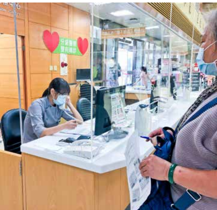
骨髓幹細胞中心同仁在住院中心協助通知住院者及陪病者提早入院前篩檢，或是在服務臺接聽遠距視訊門診專線，協助民眾預約掛號。

跨領域，即是另一門專業，例如因應疫情加開的遠距視訊門診服務，同仁在服務臺遠距門診預約掛號專線協助接聽預約，在病歷室為遠距視訊門診的民眾說明如何下載手機視訊軟體與協助醫師視訊設備操作，在住院中心的同仁則是協助通知住院者及陪病者提早入院前篩檢，並協助擔任傳送，將文件送到病房書記或護理站等業務。感恩支援的原單位同仁不吝指導與協助，讓骨髓幹細胞中心同仁在新的業務很快上手，跟上腳步為民服務。