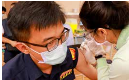
臺中慈院五月廿九日、卅一日兩天為一千位人民保母完成接種疫苗服務。

理等單位同仁現場勘查。廿八日隨即完成改裝工程，確認感染管制動線安全，並於當天中午接受衛生局來院檢查。接到審查通過公文後，醫院隨即於五月廿九日啟用