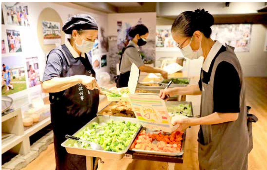
感恩中區慈濟志工愛不停歇，疫情期間仍以精簡人力為醫護人員手作元氣蔬食餐盒。