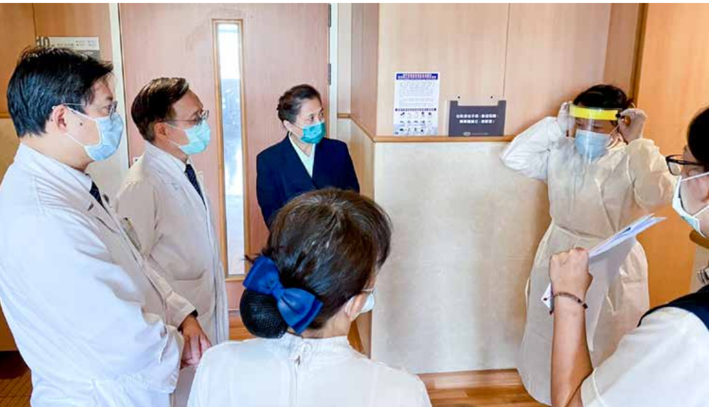
五月二十九日專責病房啟用，臺中慈院院部主管及護理單位主管巡視改裝後病房與動線，並視察值勤同仁是否能執行防護衣穿脫標準流程。