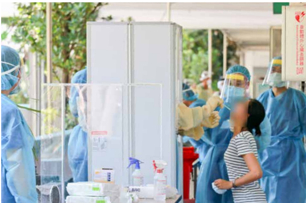
臺中慈院採檢團隊前往國小支援快篩任務。