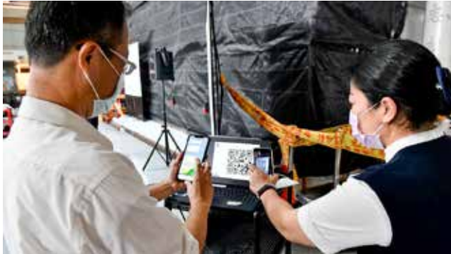
同仁可透過登入系統，填寫執行細項累計積分、記錄實踐的收穫。

日前夕發表成果，讓改變一天一點地發生，至變成習慣般自然。活動總共設計九個綠色行動和六個減碳加分項目。同仁登入「2021 大林慈濟綠成林」LINE 帳號後，會得一顆種子，連續二十一天回饋填寫自己的綠行動及減碳加分項，可以獲得積分，累積達三百分則完成任務，同時種子也會變成大樹，二〇二一年希望能募得至少三百棵大樹。