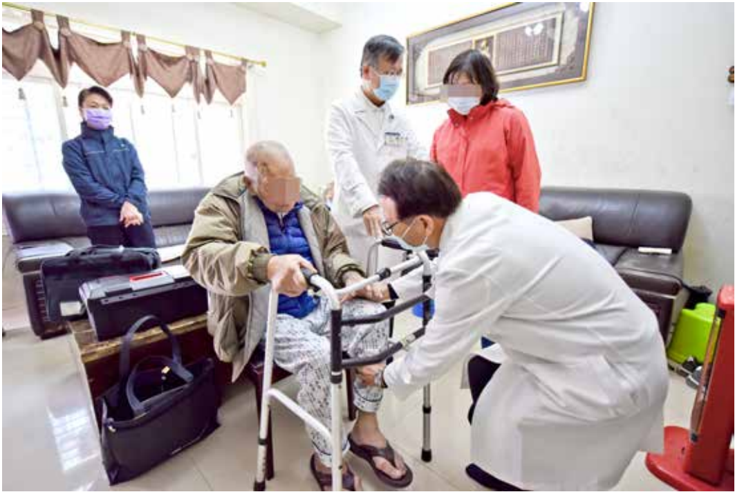
兩位醫師悉心引導阿利阿公及家屬如何練習腳部的伸展運動。

來探望，高齡九十歲的她參加區公所的樂齡學堂，跟著動健康，「生活有目標，學習才藝、做手工，對老人家很有幫助。」