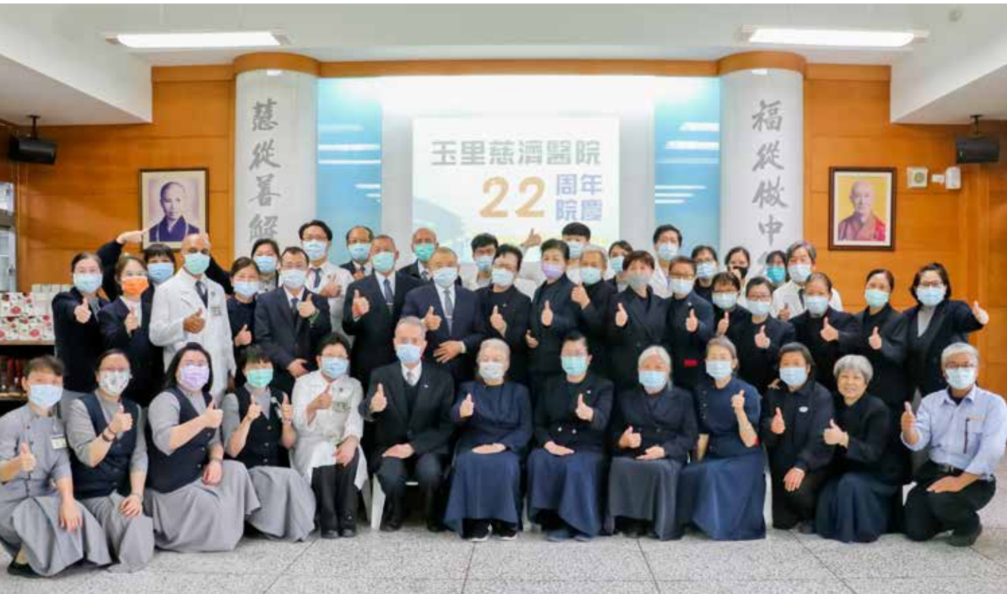
玉里慈院二十二周年院慶，齊心守護在地鄉親健康始終如一。