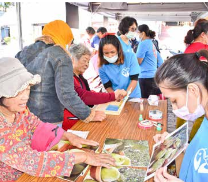
關山慈院與慈濟基金會共同舉辦蔬食環保活動，配合各種健康議題和募心活動，以趣味闖關方式鼓勵民眾響應。

也較高，若能在飲食中增加含有抗氧化物質的蔬食，包含維他命 C、胡蘿蔔素等都可以有效減少氧化壓力和發炎物質的產生。另外，腸道的細菌會因為尿毒的上升造成菌落改變，若再吃進肉類分解的胺基酸，就容易被代謝成有毒的物質，這些有害的物質會讓身體加速發炎，造成肌肉的流失。若增加每一餐的蔬菜量，對於體質的改變是有幫助的。