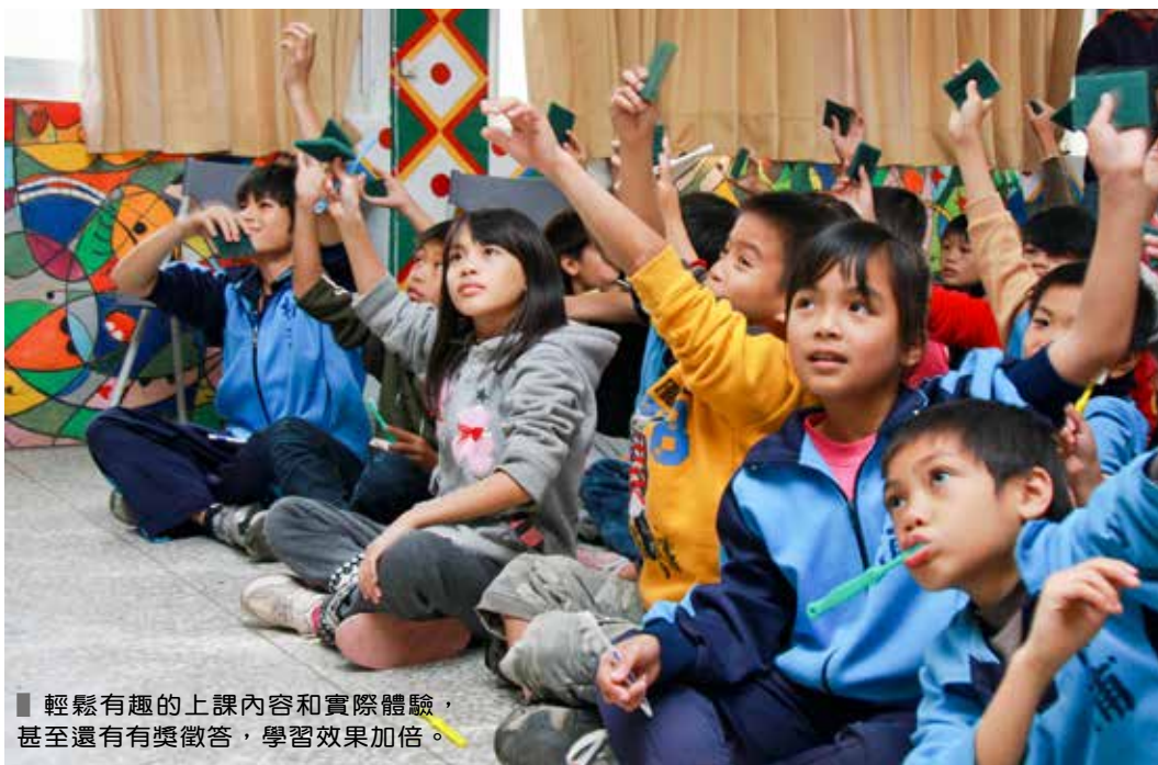
■ 輕鬆有趣的上課內容和實際體驗， 甚至還有有獎徵答，學習效果加倍。