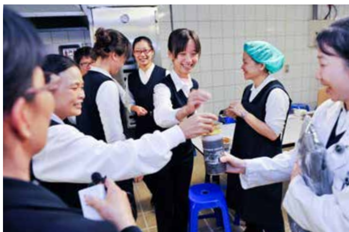
■ 營養師與廚師等同仁們將零錢投入竹筒，期許民眾珍惜餐桌上的每一口食物。