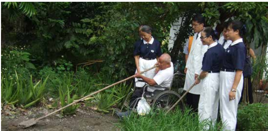
■ 坐輪椅的潘阿公不因行動不便而失意，他善用長柄工具做農事的功夫讓大家嘆為觀止。