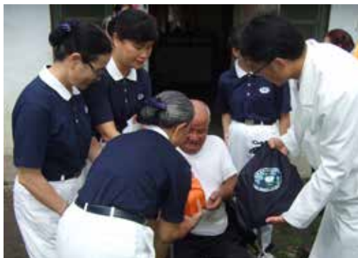
■ 潘院長和志工們帶來滿滿的關懷，讓獨居的老人感受中秋節團圓的喜樂而備受感動。