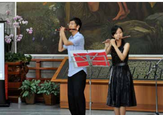
■ 為臺南藝術大學音樂系負責吹奏的「主角」以笛子互相配合，完成「頂嘴」活潑俏皮的曲目。

場曲，逗趣的演奏風格就似人與人彼此相互鬥嘴，精彩的笛聲你來我往、此起彼落，讓民眾拍手叫好。藉由這場音樂饗宴，也讓病患可以洗滌心靈塵垢，頓時忘記身上的病痛。