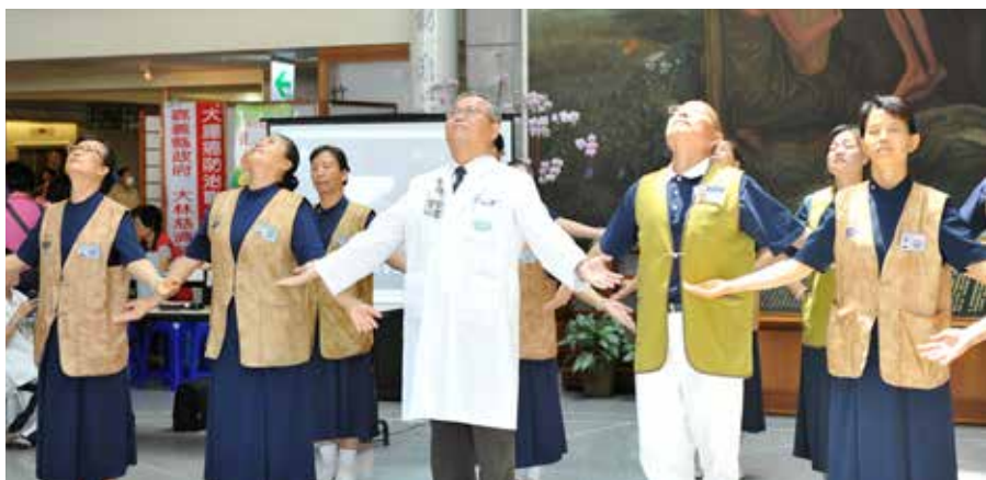
■ 志工與蘇主任共同帶來一小段水懺的手語，莊嚴的演出讓坐在臺下的觀衆專注跟著比畫。