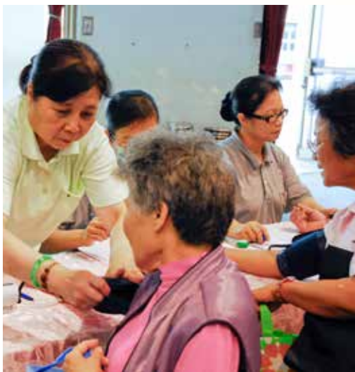
■ 慈濟的志工們替前來檢查的鄉親們量血壓並記錄健康情況。

場次，計四萬零三百二十七人次接受服務，結果得知有些民衆甚至有兩項以上的檢測不合格，因此統計發現異常高達有四萬兩千五百六十六人次。