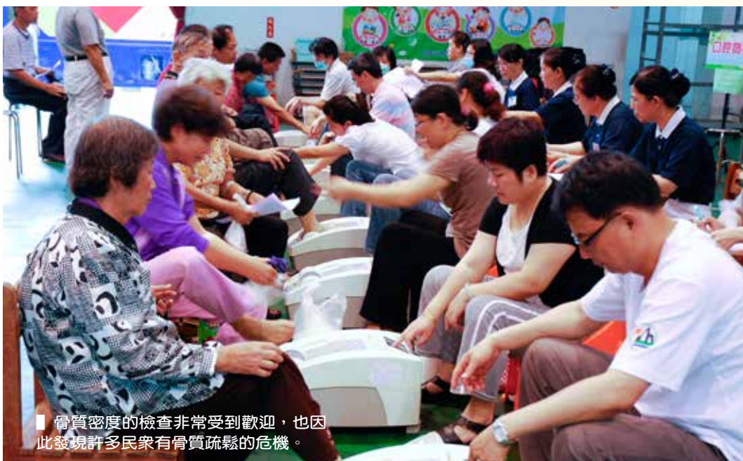
■ 骨質密度的檢查非常受到歡迎，也因此發現許多民衆有骨質疏鬆的危機。

此次的篩檢活動除了整合多元化醫療資源，提供民衆精密、便捷及豐富檢查項目外，更有「顧健康，搏感情」的衛教宣導區，讓民衆透過答嘴鼓（說唱藝術）、魔術表演及各項遊戲宣導攤位，輕鬆愉快學習健康知識，精彩的演出逗得阿公、阿嬤笑呵呵，開心等候不無聊。