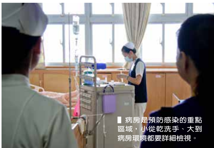
■ 病房是預防感染的重點區域，小從乾洗手、大到病房環境都要詳細檢視。