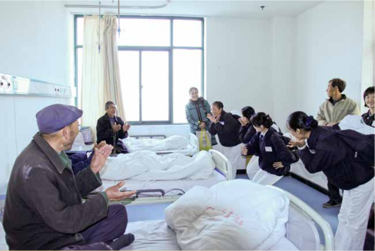
在志工們的帶動下，病房裡的爺爺們擺脫對手術的擔憂，放開心胸高歌數曲。

志工們來到眼科病房時，正值入出院的交接時段。已完成手術被允許出院的老人們，滿心歡喜地和家人一同收拾行李；而準備接受術前檢查尚未入院的老人們，在當地殘疾人聯合會幹部及護士的引導下，排隊進行身分登記。