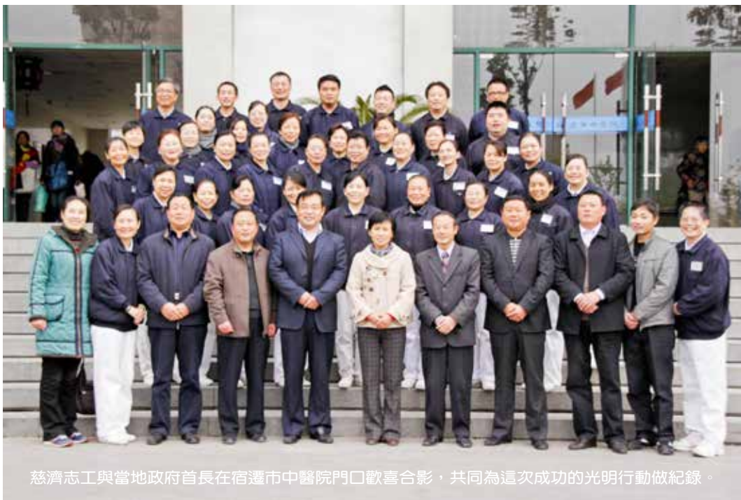
慈濟志工與當地政府首長在宿遷市中醫院門口歡喜合影，共同為這次成功的光明行動做紀錄。