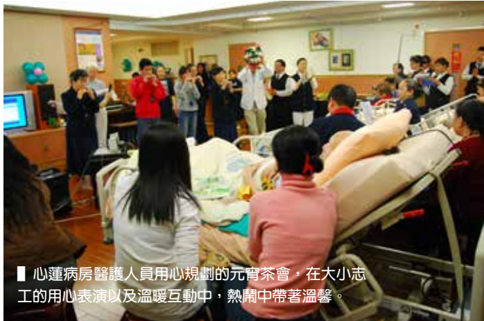
■ 心蓮病房醫護人員用心規劃的元宵茶會，在大小志工的用心表演以及溫暖互動中，熱鬧中帶著溫馨。