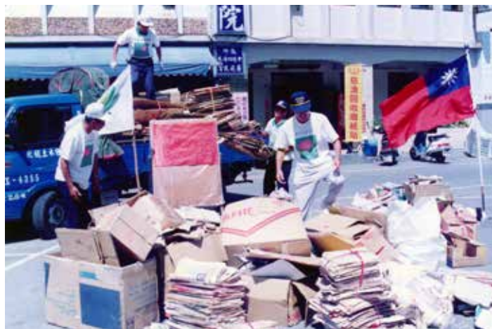
■ 一九九〇年代，環保志工們以鴻德醫院前的玉里圳停車場作為紙類回收的據點。