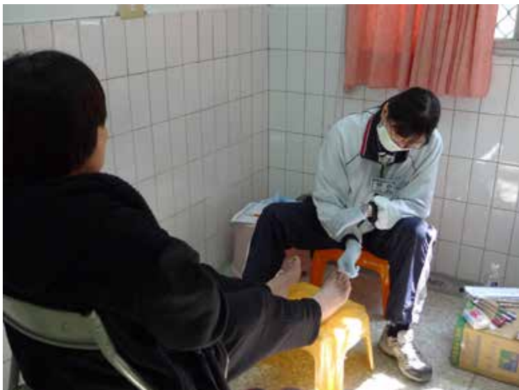
■ 護理同仁協助患者檢查足部，以了解糖尿病是否有侵犯到足部健康。

他也建議大林的同仁，可以將篩檢時所需用到的器材用行李箱裝好，方便拖著走，如果有缺少的物資，回到醫院也可立即補貨，像花蓮慈院的同仁外出時，連窗簾都會隨身帶。許主任的建議，讓大林的同仁深覺受益良多，忙著在一旁記筆記。