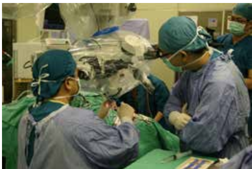
■ 臺中慈院耳鼻喉科團隊正在為病患進行人工電子耳手術，也因為具有這項技術的軟硬體，承擔起臺灣中區民眾聽力健康的責任。

另一個讓人工電子耳患者安心的是，慈濟基金會與慈濟醫院正推行「全人照護」，透過專人訪視、照護，以及專人服務的一百小時免費聽能復健，讓病患在家就能依照電腦操作軟體自我練習，開心迎接新生活的來臨！