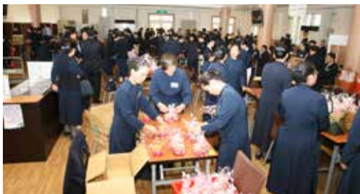
■ 近三百名懿德家族的爸爸媽媽齊聚臺中慈院，精心為他們在慈院孩子準備年節賀禮。