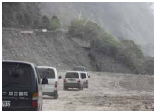
■ 前往豐山村陸上道路不通，浩蕩長的車隊行走在顛簸河床上前進。

雖是首次來到豐山義診，志工們卻是個個身手俐落，從車上逐一卸下各種器具、藥箱，確認定點後立刻組裝。宛如魔術師般，一個迷你的綜合診所立即成型，足見這群醫護志工平時訓練有素，經驗豐富。