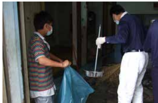
■ 慈濟志工幫忙打掃環境，讓小民一家可以舒服過個年，小民貼心的拿著垃圾袋在一旁幫忙。