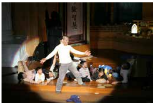
■ 在新春團拜中，由四大志業同仁模擬海地發生地震時，驚天動地的一刻，讓眾人見證大自然的反撲力量。

「愛的手牽我走，幸福的起點，並肩走過。愛的手牽我走，幸福的永遠，有你和我……」除了精心準備「千手菩薩拳」外，護理團隊也安排了「幸福的起點」手語歌表演。由於每個同仁的輪班時間各異，要能全員到齊一起練習著實不易。儘管困難，同仁還是很用心，