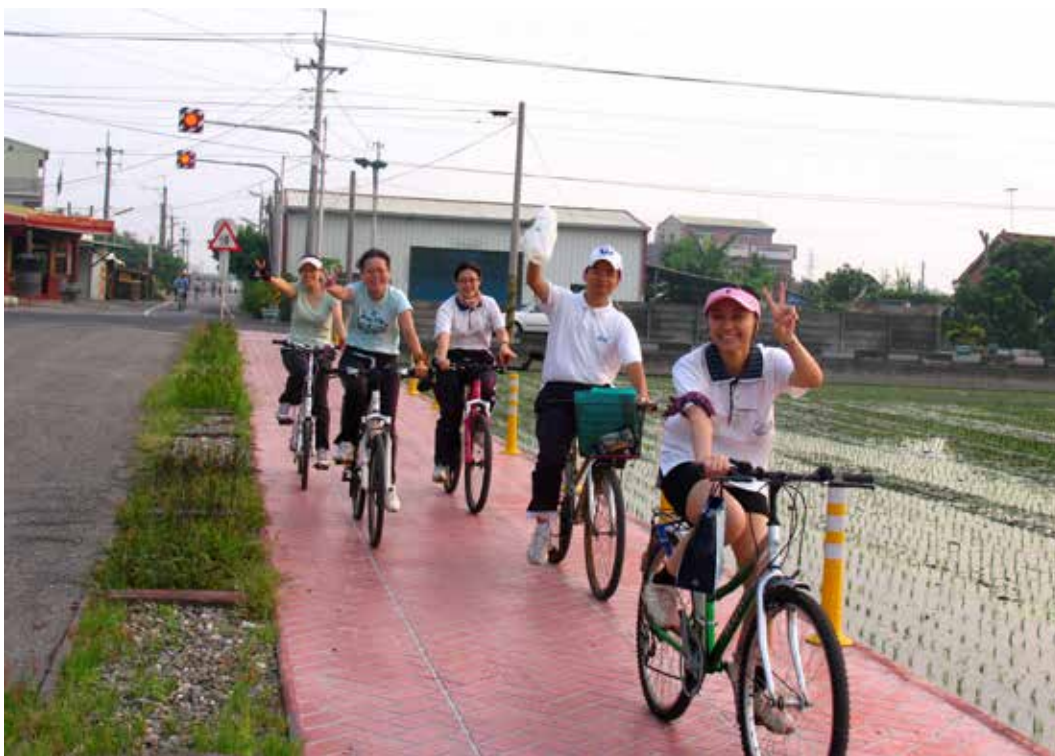
■ 在工作與運動之間求取平衡，有健康的身體，才能認真工作，幫助病人。圖為大林慈院同仁自行車運動。

隨著每星期的騎單車活動延續，不但參加的成員愈來愈多，騎乘的距離也逐漸拉長，即使不是原本約定的日子，也會私下相約一起去運動。如今，騎單車已經成了大家共同的活動，尤其每到星期五，大家總是彼此提醒，要趕快把工作做完，才能一起出遊去。