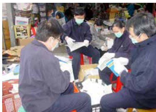
■ 在寒冷的氣溫下，大家圍成一圈分工合作，更互相打氣比喻成「圍爐」，越做心越暖。

「今天，咱們一定要做到流汗才回家啦！」這場另類的「圍爐」聚會中，同仁們越做越起勁，儘管氣溫幾乎只有十度上下，彼此勉勵，堅持到底，用熱心驅走涼意。