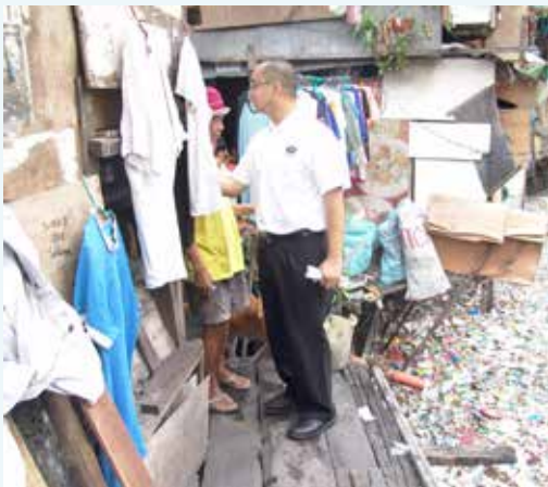
■ 菲律賓的牙科巡迴往診團隊深入貧民區去尋找需要幫助的病人。