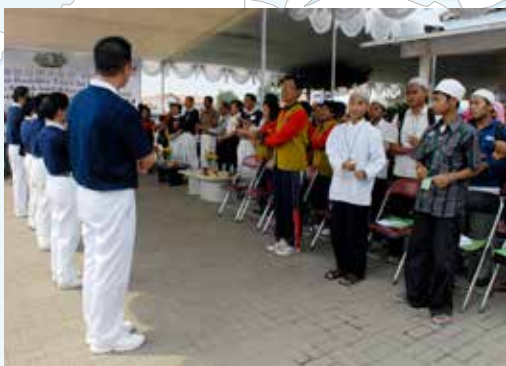
■ 慈濟志工邀請所有來賓與義診病人一起比手語邊唱歌。