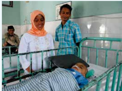
■ 看到孩子手術順利，巫仔夫妻的幸福寫在臉上。