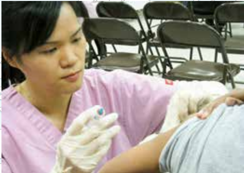
■ 義診還提供流行性感冒疫苗注射。圖為護士正為居民注射疫苗。