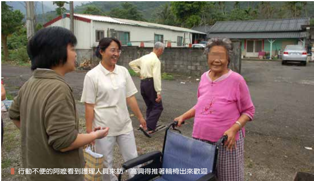
行動不便的阿嬤看到護理人員來訪，高興得推著輪椅出來歡迎。

蘇秀惠表示，進行腹膜透析需要盡量無菌的環境，病患在院期間，他們都會教導一系列的正確操作方式，但是回到