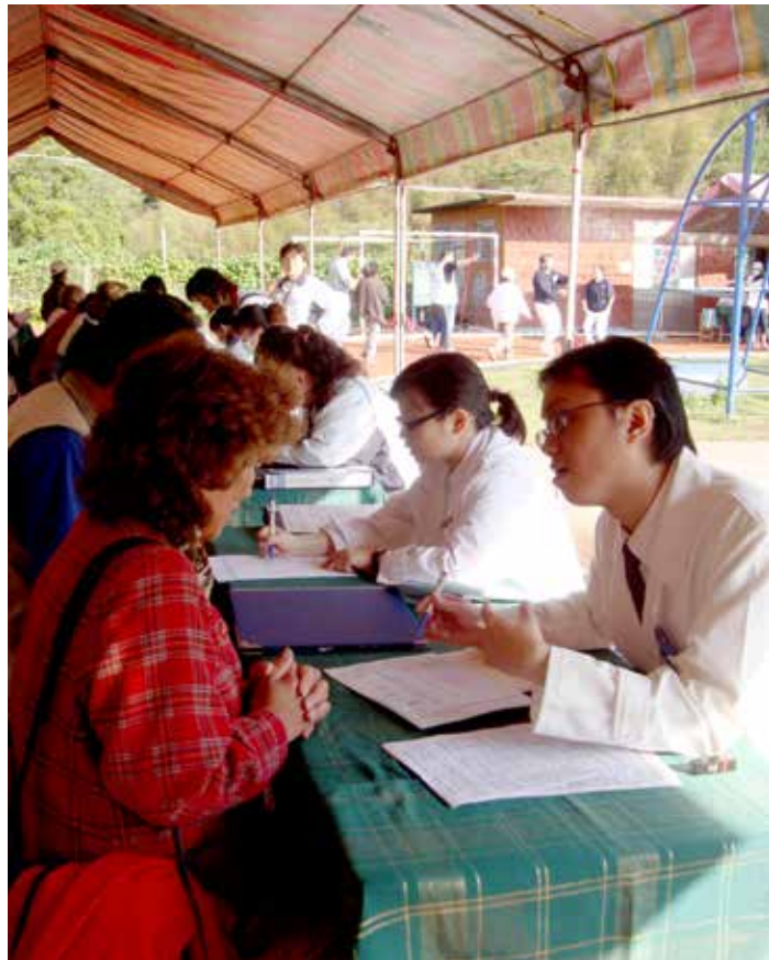
■ 大林慈院到社區進行複合式篩檢，檢查完畢後會再到社區發檢驗報告，並由醫師親自講解接受諮詢，也有護理師為民眾進行衛生教育。

自一九八六年世界衛生組織發表渥太華憲章(The Ottawa Charter)後，健康