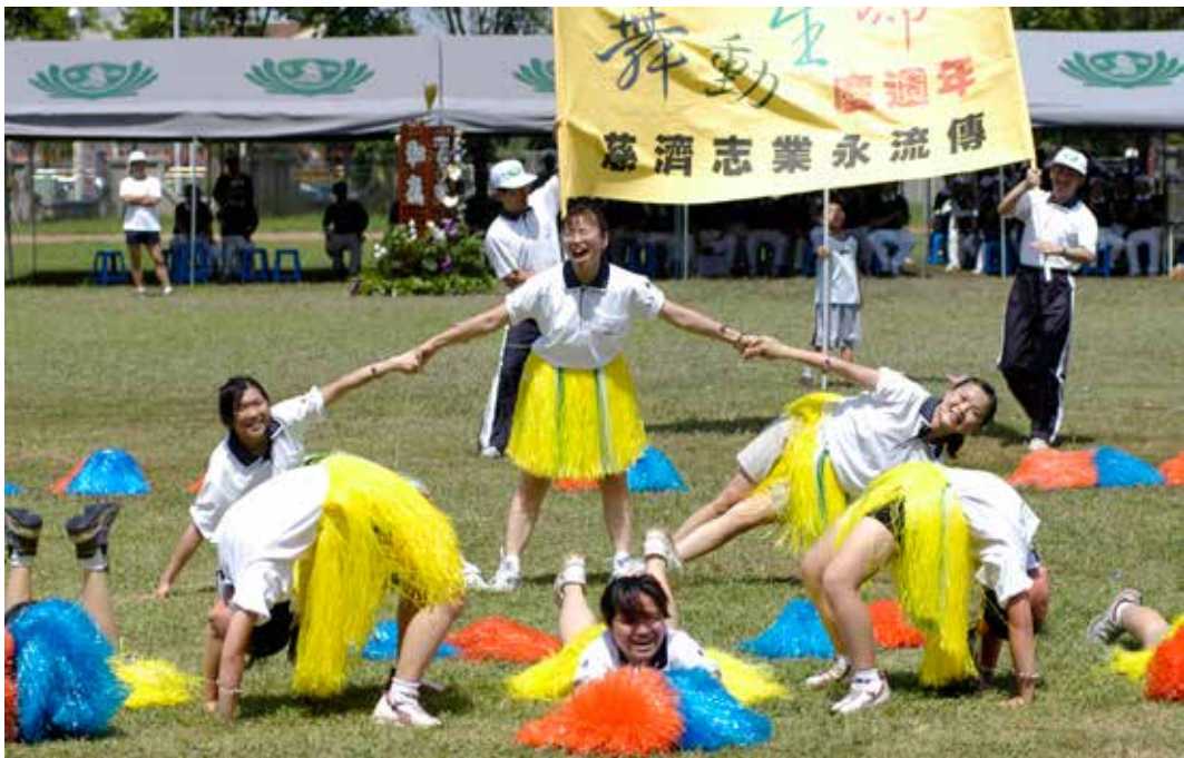
■ 每年的運動會是大林慈院同仁展現健康活力的一面，也是全院促進健康的表現時機之一，歡迎社區民眾共同參與。