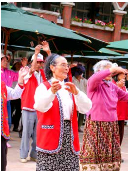
■ 三月二十九日大清早的阿里山上，大林慈院醫護同仁與志工就已經帶著鄉親做運動，等會兒即將開始複合式篩檢。

三月二十九日清早，天還未亮，前一晚便上阿里山準備複合式篩檢的工作人員，紛紛前往樂野國小、新美國小這兩個活動會場進行準備。為了配合山上居民的作息，這次特別將篩檢時間提早到五點三十分開始。沒想到，工作人員於四點三十分抵達現場時，已有許多鄉民摸黑前來等待。難得這麼早起床，不少人剛到現場時都有點睡眠惺忪，一位鄒族阿公說，因為擔心睡過頭，所以早上二點就起床，四點就到樂野國小。