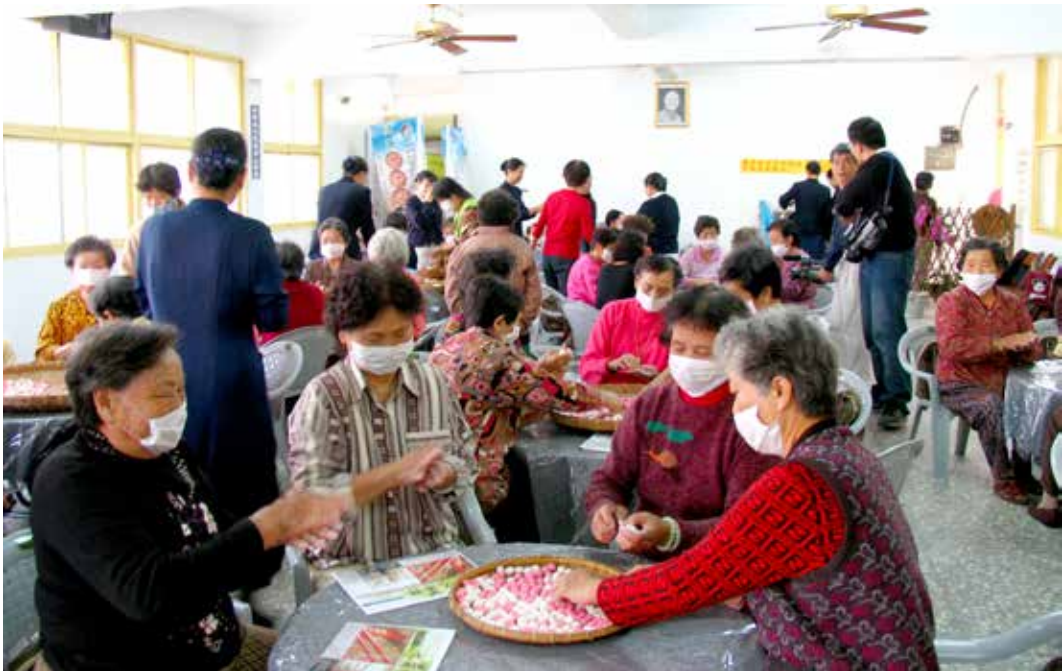
■「健康甘仔店」是大林慈院推動社區營造廣受歡迎的項目之一，許多老人家因此找到生活的重心，非常樂於參與。