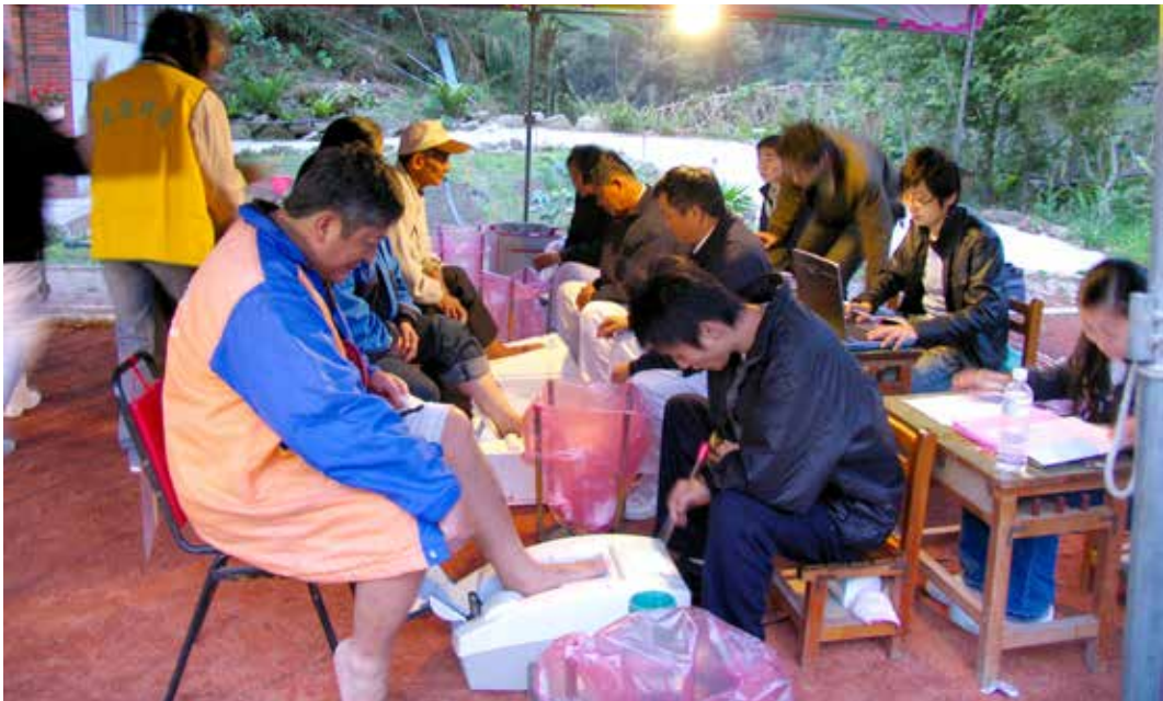
■ 健康促進醫院的概念，是將醫院變成有機體，讓病人、家屬、員工與社區民眾，大家都健康。

大林慈院，是健康檢查、看病一定會來的專業醫院，也是大嘉義地區社區民眾熟悉的一個活動場所，有時來看表演，有時來參加活動。這裡，有快樂健康的同仁，提供親切、專業的服務，這裡，是健康促進醫院；大林慈院祝您也助您，身體健康心平安。