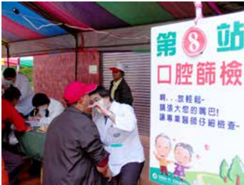
■ 圖在照顧病人與社區民眾健康的同時，醫護同仁更要善用方法促進自己的健康。

促進醫院的概念逐漸在世界各國受到重視。渥太華憲章中提到，必須要重新調整健康服務的取向，健康部門如：醫院的角色應超越以往僅提供臨床與治療的服務範圍，朝向健康促進方向改變。渥太華健康促進憲章所訂的五大行動綱領，便是推動健康促進的行動準則，包括建立健康公共政策、創造支持性環境、強化社區行動、發展個人技巧、重新調整服務方向；這也是大林慈院依循推動的策略重點。