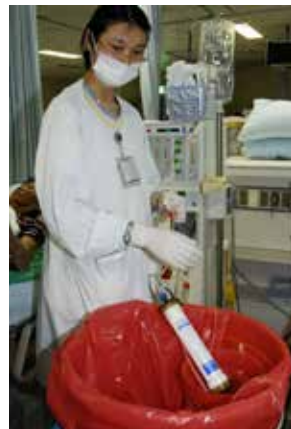
■ 大林慈院各科室也努力找出節能環保好方法。圖為血液透析中心用心減少醫療廢棄物。