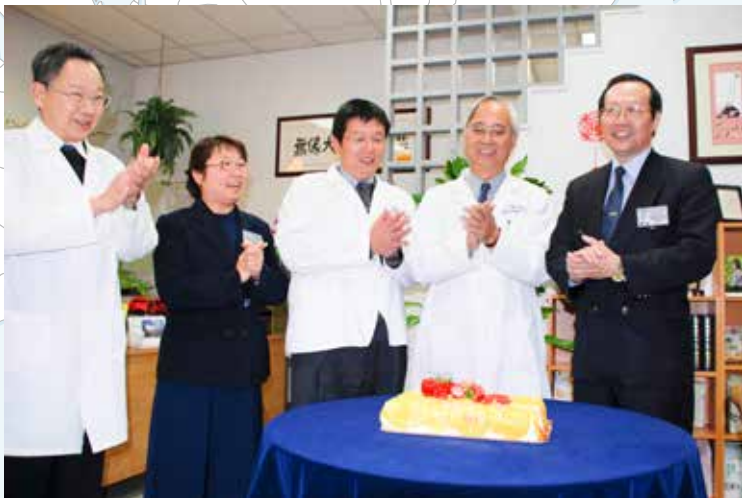
眾醫師齊聚一堂，唱《無量壽福》祝福中醫門診滿週歲了！