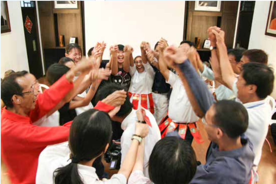
穿上由紅包袋做成的圍裙，病友們和當晚出席的醫護人員、志工們隨著音樂而舞動雙手，現場喜氣洋洋。

贈送結緣品的時刻到來，由照念師父親自交到志工們的手中，把醫護同仁的感恩與祝福真誠地傳到了一路以來無怨無悔護持洗腎中心的志工們。