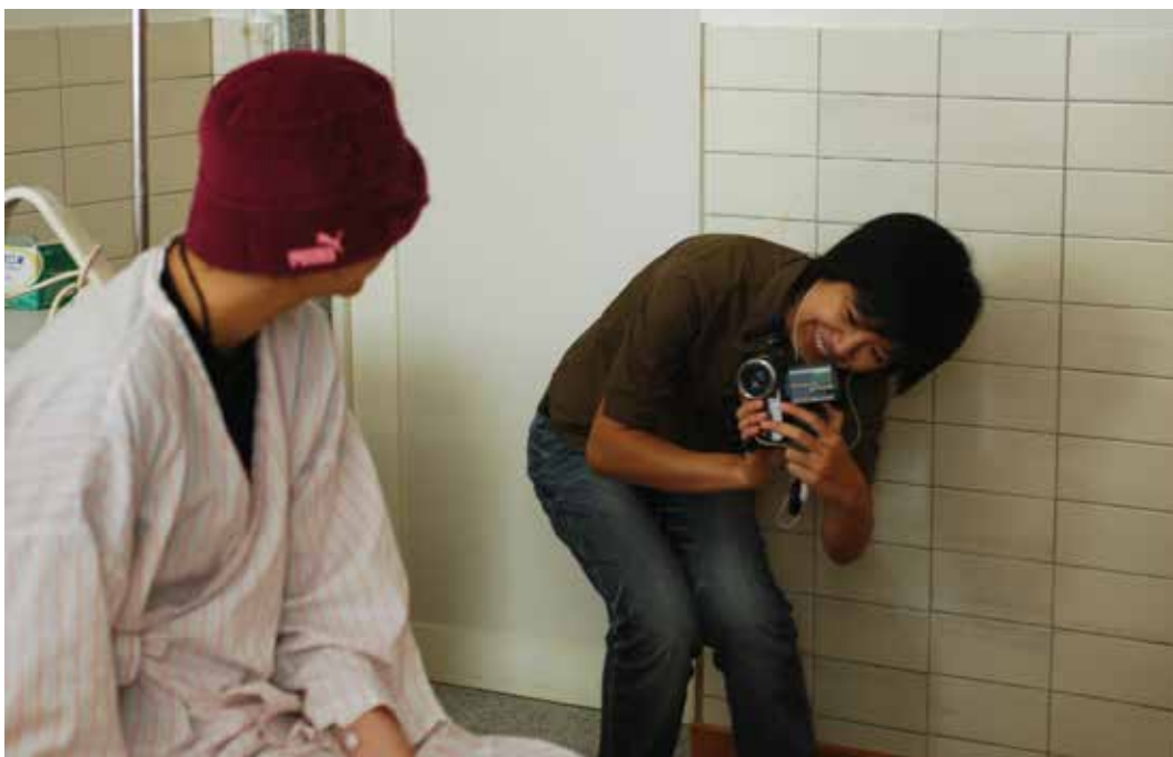
心蓮病房的影視志工也是共同照護的成員之一，甚至也與病人變成朋友。圖為志工來探看病人，送給病人一個小禮物後，病人開心地請她拍照留念。