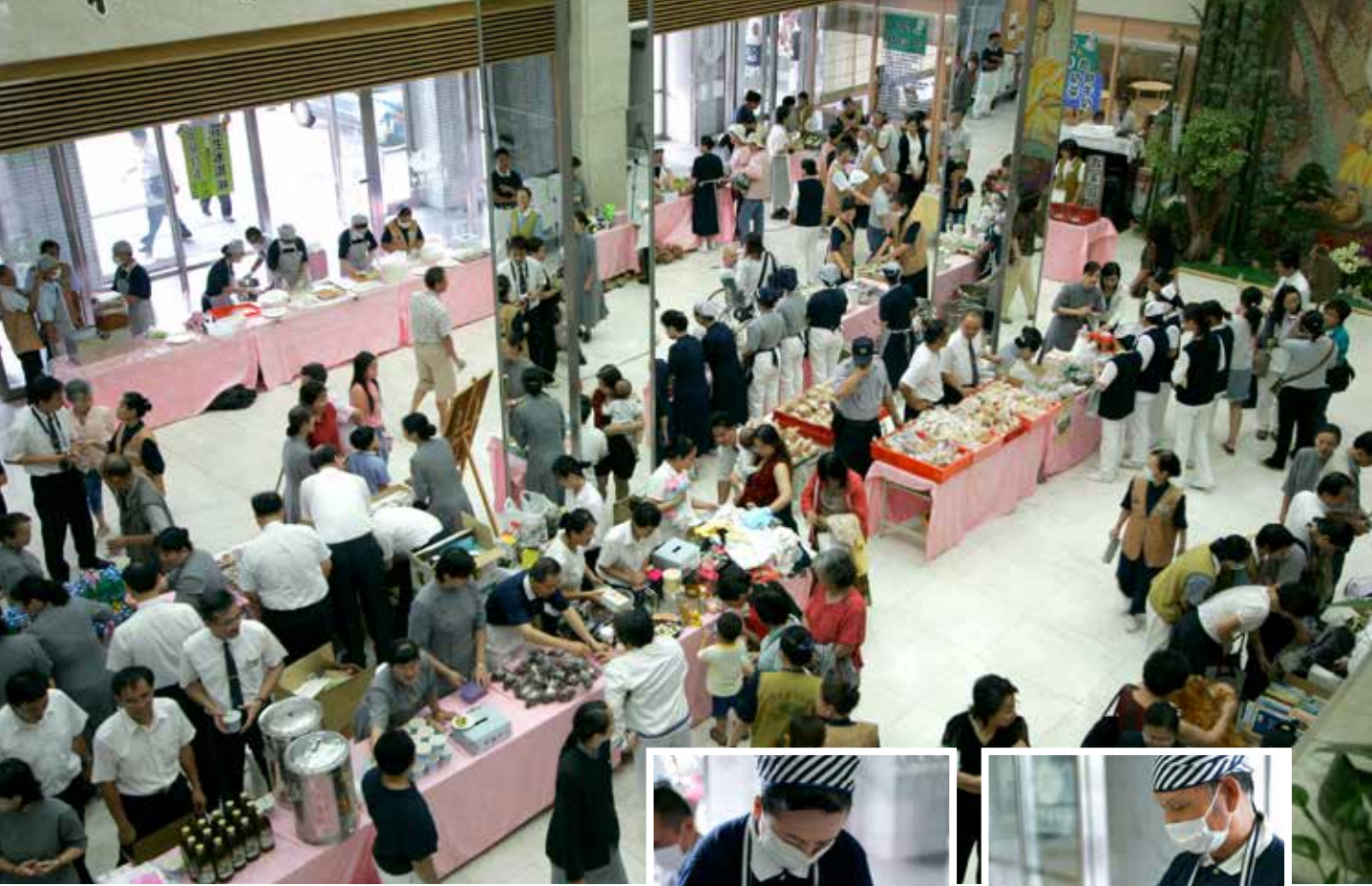
攤位上穿戴同花色頭巾圍裙的是從宜蘭來的師兄師姊，帶來春捲、花生糖，做出花生冰淇淋特產。