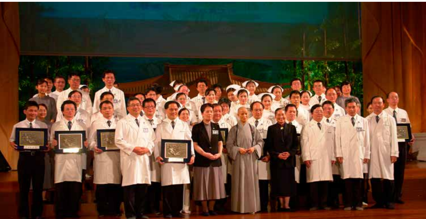
上人於院慶大會中頒獎給醫學中心評鑑各分組負責同仁，感恩全院的付出耕耘終使慈院評鑑順利通過。