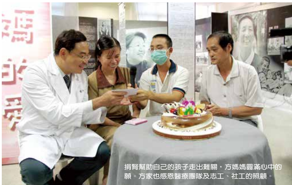
捐腎幫助自己的孩子走出難關，方媽媽圓滿心中的願。方家也感恩醫療團隊及志工、社工的照顧。

移植手術最後圓滿完成，方先生有了健康的腎臟、媽媽圓滿了心願，而父親也終於鬆了一口氣。在他們的身上，沒有華麗的衣裳打扮，卻有著至為璀璨富足的親情；雖然遭逢重大生命轉折，彼此沒有無謂的埋怨與責怪，取而代之是深刻的祝福與感恩。他們的故事，除了為大林醫療團隊的移植記錄添上一筆外，也將這濃郁親情，感染了周遭的所有人。