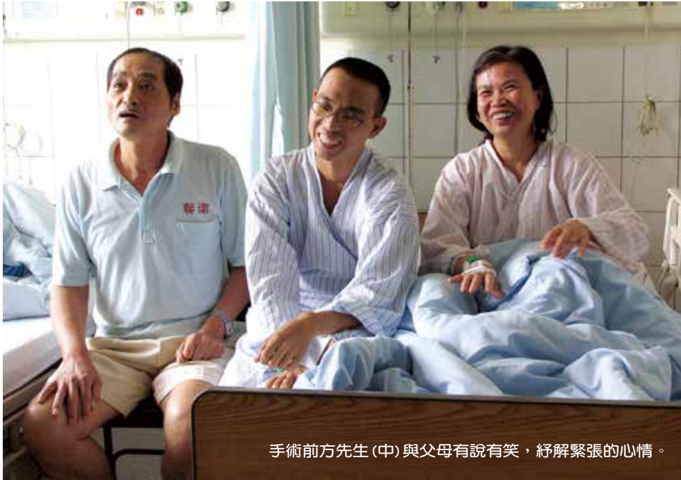
手術前方先生(中)與父母有說有笑，紓解緊張的心情。

的診治，而是急於求神問卜、打探偏方，只要聽說是對腎臟有益的藥方，無論多麼昂貴，也要買來為兒子調理身體。