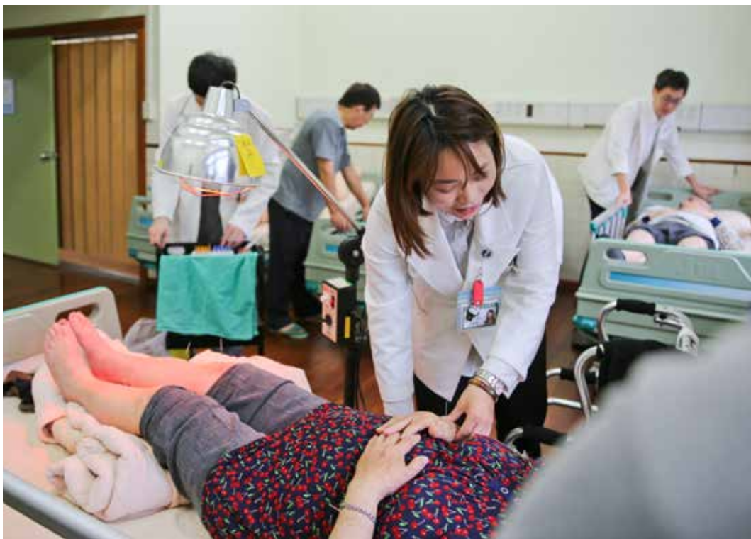
花蓮慈院中醫師團隊前往輕安居進行特別門診服務，整合中西醫治療，守護長者的健康。