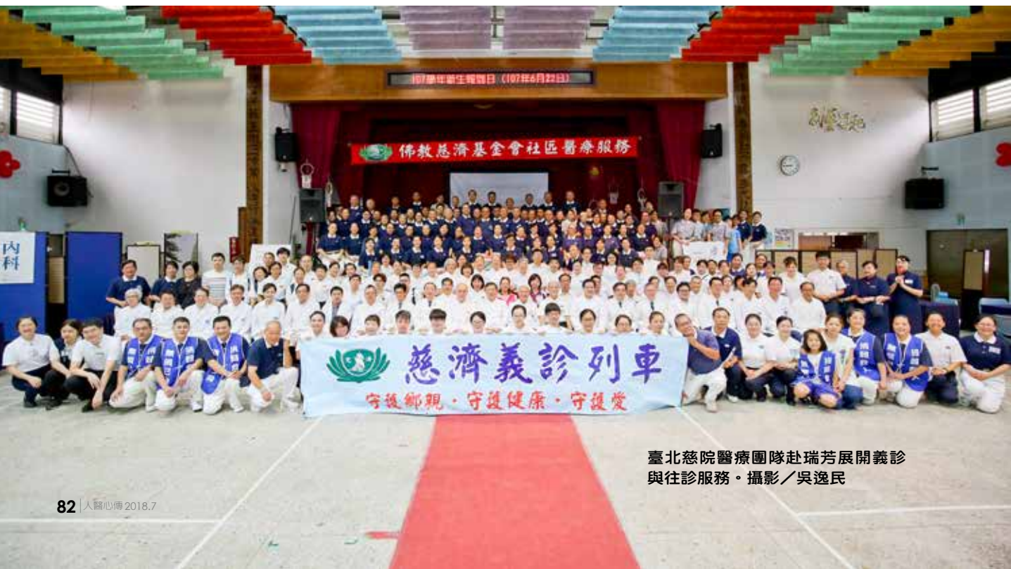
臺北慈院醫療團隊赴瑞芳展開義診 與往診服務。

五十三歲的李先生有高血壓、糖尿病，雙眼因白內障和視網膜剝離皆失明，兩次中風，行動不便坐輪椅。徐副院長握住李先生的手測試力道，詢問平常飲食、用藥和復健情形，提醒他要維持規律運動，並戒菸、戒酒，防止再次中風。