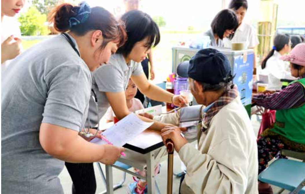
護理同仁在義診現場親切為來診民眾進行檢查。