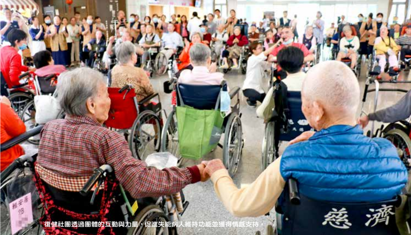
復健社團透過團體的互動與力量，促進失能病人維持功能並獲得情感支持。

先後在護理之家成立「韻律舞」、「『站』勝平衡」與「拉筋伸展」三個社團，治療師依不同住民的動作、認知功能差別，設計不同的治療計畫，例如：韻律舞團裡，以長輩熟悉的臺語歌曲帶動跳，練習舉手洗頭、彎腰穿鞋等動作；『站』勝平衡團加強促進外出行走和防跌，增加長輩外出參與休閒娛樂機會；拉筋伸展團讓動作與認知較差的長輩，透過持續活動維持功能。重點在於讓長者有機會參與更多日常活動，將動作上的進步運用在生活中，不但達到復健目的，更能促進生活品質，保持手、腳有力，還要做到能盡量自己刷牙、洗臉、穿衣服。