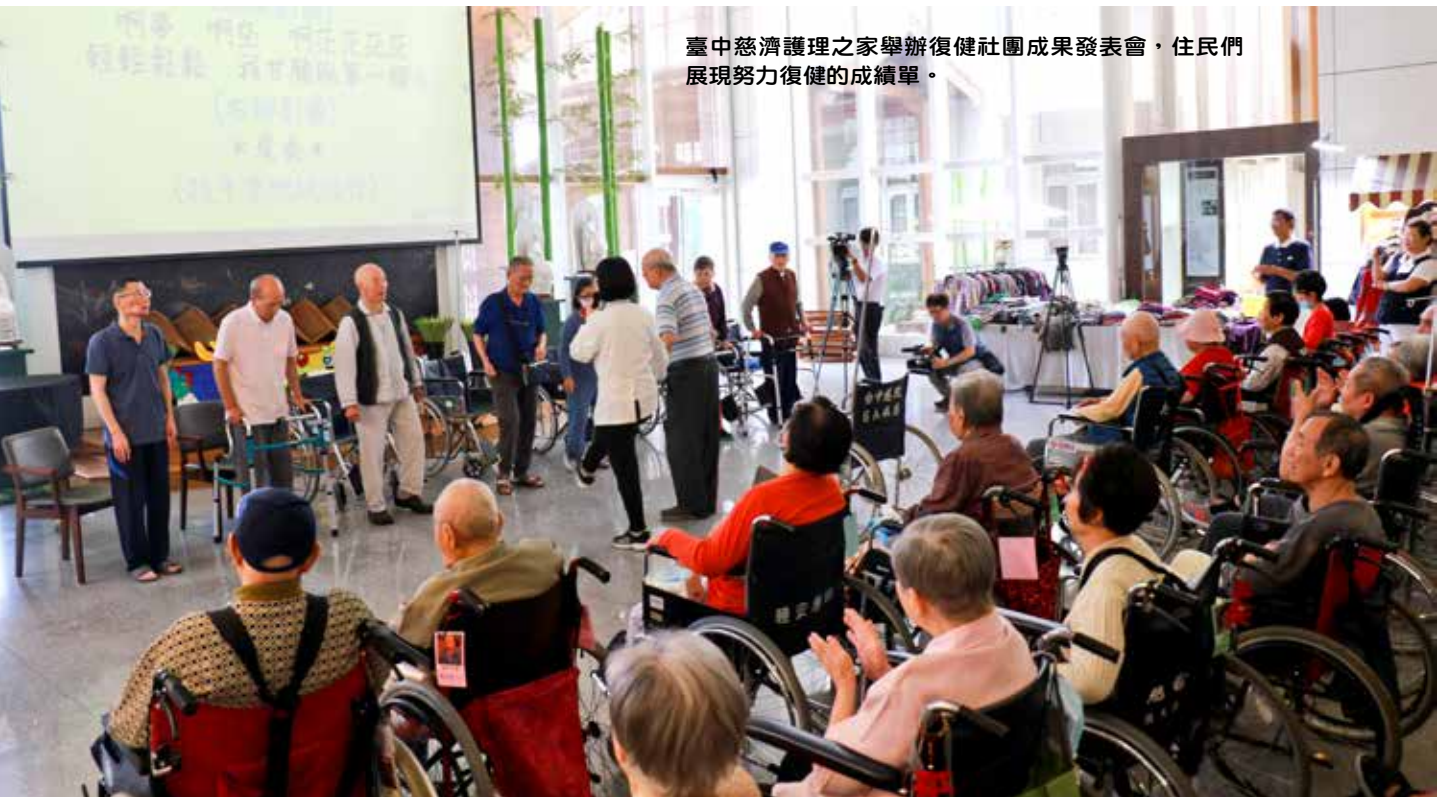
臺中慈濟護理之家舉辦復健社團成果發表會，住民們展現努力復健的成績單。