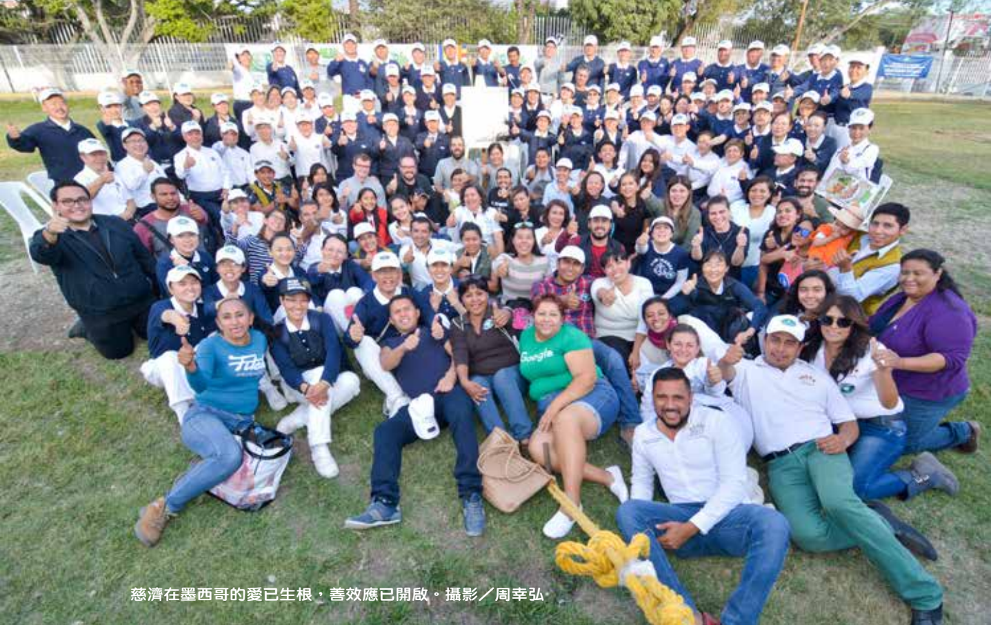
慈濟在墨西哥的愛已生根，善效應已開啟。

媽讓我印象深刻。這位小女孩出生即雙眼失明，無法自行走路，媽媽抱著她來，看看我能不能幫助她的女兒。小女孩有智能障礙，但卻不停唱著歌，我不知該如何對媽媽說實話——其實依照小女孩的狀況，醫療能提供的有限。很不忍的看著這對母女，但當下轉了念，我對媽媽說，「妳的女兒一直快樂的唱著歌，她其實是一個沒有煩惱、沒有恐懼的小天使，媽媽是最偉大的媽媽。」同時送上一個平安吊飾與她們結緣，希望上人的愛永遠陪伴她們，並對媽媽說：「佛陀會保佑妳們！」