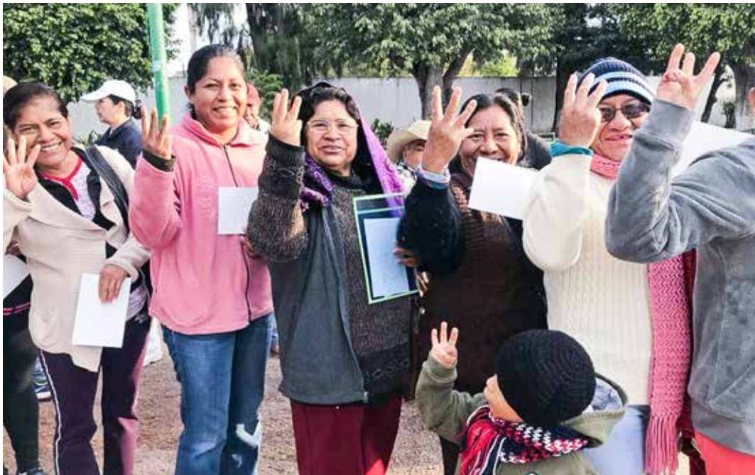
墨西哥鄉親們舉起手比出三或四，表達友善的招呼。

便不認識，卻立刻展現無比熱情，以他們的方式表達對我們的讚美與感恩。前往發放與義診場地的路上，當地鄉親用他們慣有拉大嗓門的說話方式，熱情介紹慈濟隊伍。兩個多月來，慈濟志工在當地以愛和關懷用心付出、誠心對待，讓鄉親們非常感動，所以一看到藍天白雲就會很歡喜。因為慈濟隊伍浩蕩長，行進間，不時聽到汽車喇叭聲，擔心是隊伍影響行車動線，趕緊提醒大家加快腳步，但仔細一看，才了解鄉親按喇叭不是在催促，而是希望我們看到他們在車內比起大拇指向我們致意。