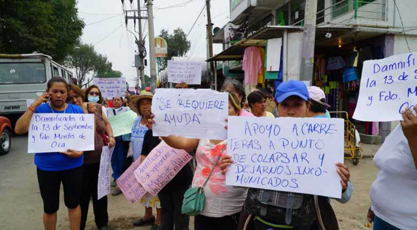
墨西哥普埃布拉州於二〇一七年九月十九日發生強震，造成震央附近及首都墨西哥市許多老舊建築物倒塌，民眾傷亡慘重，災民自製向外界求援的海報文字。

二〇一七年九月十九日，墨西哥普埃布拉州當地時間下午一點三十分，發生芮氏規模七點一的大地震，震源深度僅五十一公里、屬於淺層地震，傷亡人數逾千。而在十二天前的九月七日，墨西哥南部才發生一場規模八點一的地震，造成近百人往生。