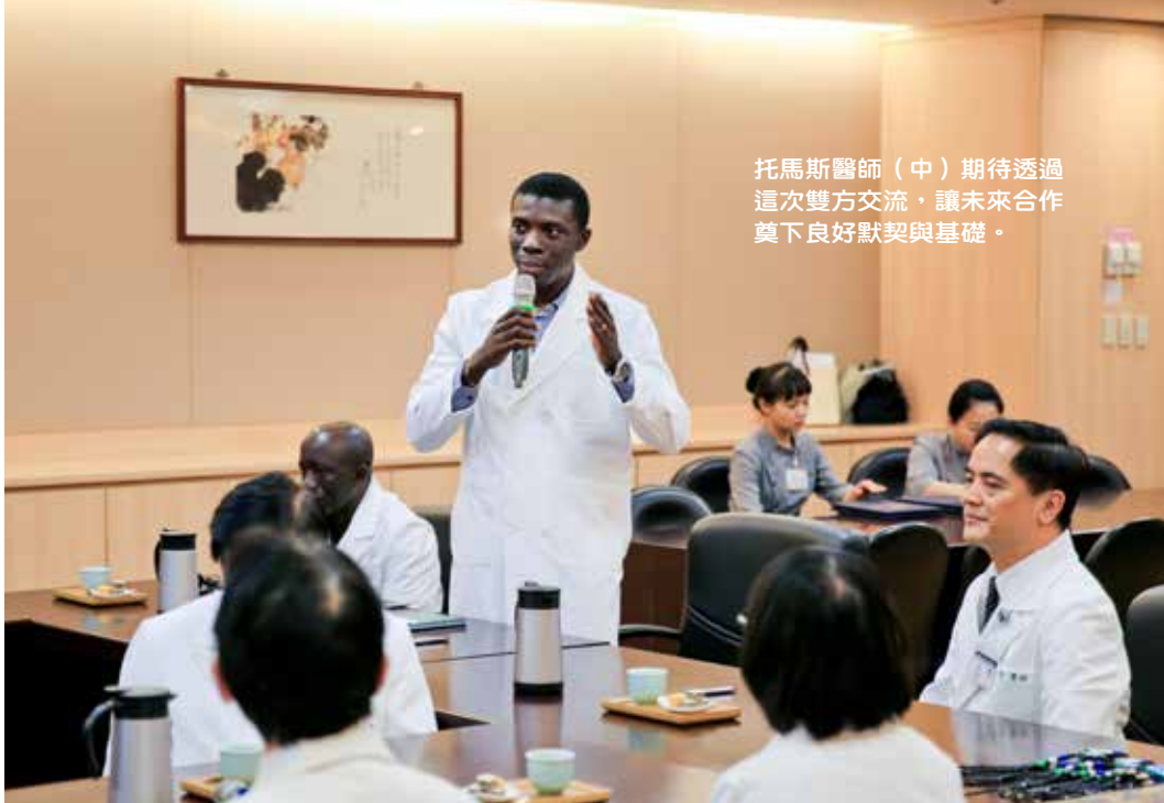
托馬斯醫師（中）期待透過這次雙方交流，讓未來合作奠下良好默契與基礎。

示，二〇一四年伊波拉病毒在西非爆發時，兩萬八千多人受到傳染，其中一半病例集中在獅子山共和國，而當地所有的病人都送往世界衛生組織指定的防疫醫院「三四軍事醫院」接受治療。