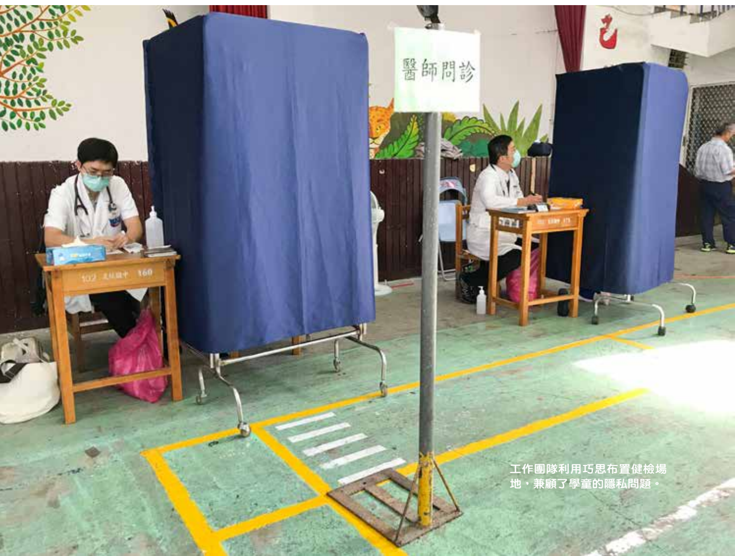
工作團隊利用巧思布置健檢場地，兼顧了學童的隱私問題。

早上七點多，校園裡一片冷清，健檢團隊已經上工忙碌了。卸下各式設備、一一清點器材，就是希望讓檢查順利完成。像是學生做心電圖檢查時需要掀開上衣，所以要格外注意他們的隱私問題，工作團隊利用各種巧思克服場地的不便，中間綁上布條就能簡單隔成兩個空間；隔簾間的縫隙有點寬，掛上布巾