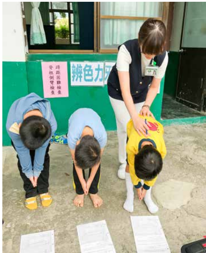
護理人員為小朋友們進行脊柱側彎檢查。

一、四、七年級的學童進行健檢服務。在五天之內要跑遍花蓮南區，不但考驗行政團隊的規劃，對醫護團隊的效率也是一項挑戰。為了確保健檢作業完整確實，前置作業在八月就已經開跑。到了九月開學季，蟻蟲和尿液檢體早早送到各校備妥，並針對回收後檢查結果異常的學童進行投藥和追蹤，整個作業流程一直持續到十一月正式進入校園進行健檢，還有後期的追蹤、評估和報告。為期數月的繁雜流程，有賴玉里慈院各單位齊心協力、共同完成。（文、攝影／黃小燕）