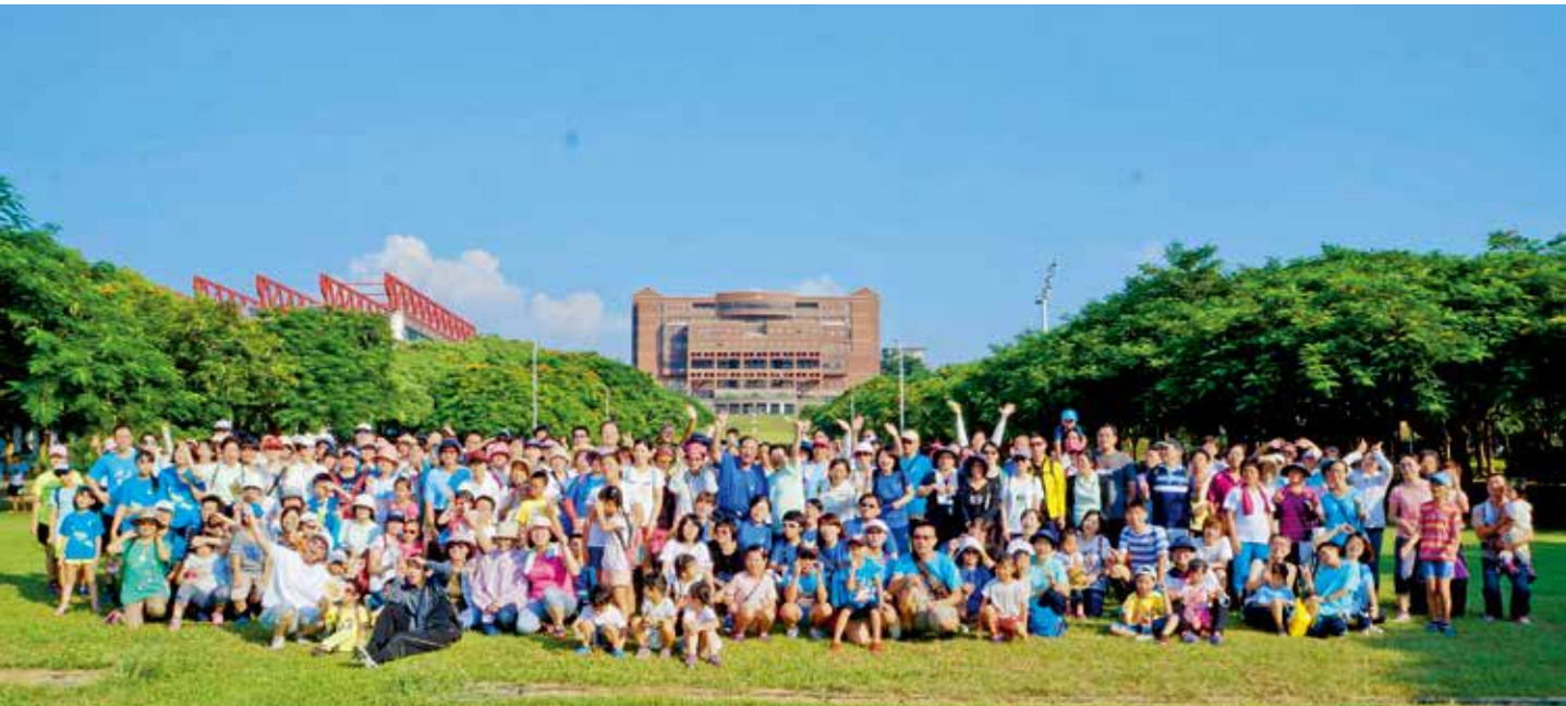
參與健走的同仁相當踴躍，這次共有三百多人參加。