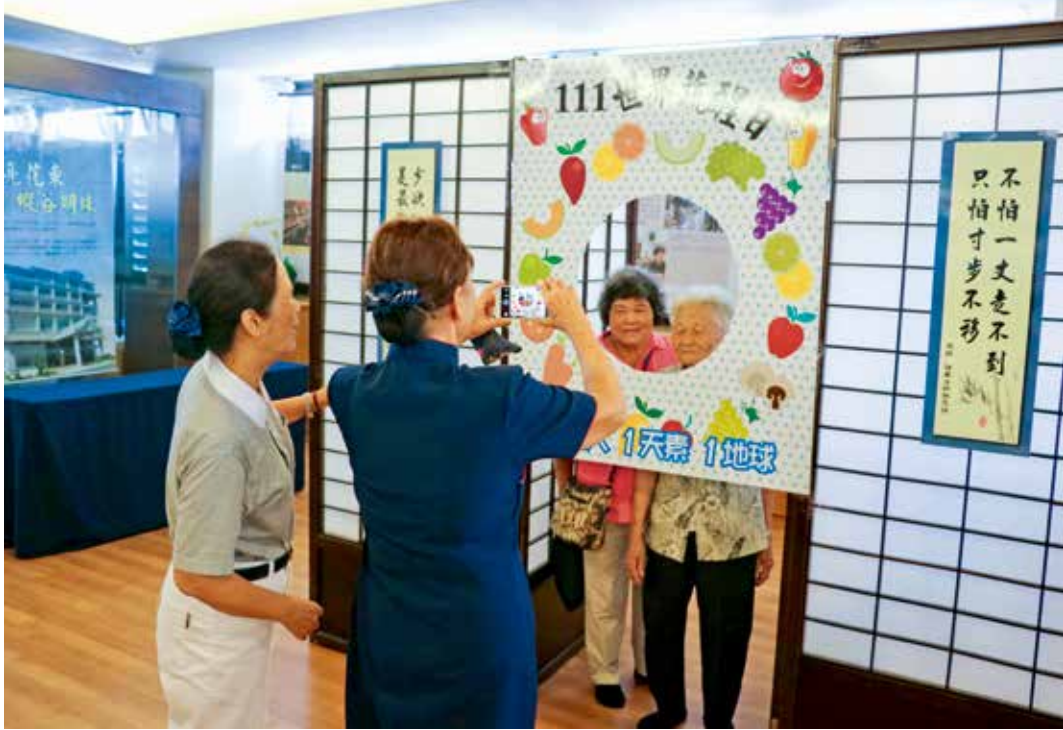
會場一樓入口側方規劃「111世界蔬醒日」海報照相專區，邀約鄉親共同響應齋戒護生的蔬醒運動。

民眾共同響應。會場一樓入口側方佈置「111世界蔬醒日」海報照相專區，期待每個人循序漸進方式逐步改變飲食習慣，透過蔬食改變世界。二樓入口處還設置了蔬醒卡簽署區，進到了祈福會場，擺放七尊琉璃佛，布置溫馨莊嚴，讓人心靈沉澱平靜而祥和，師姊們引領鄉親進入會場，並解說齋戒護生的意義，邀約加入「蔬醒」的行列，與會的鄉親不論老幼，紛紛在「蔬醒卡」上留下愛的足跡。