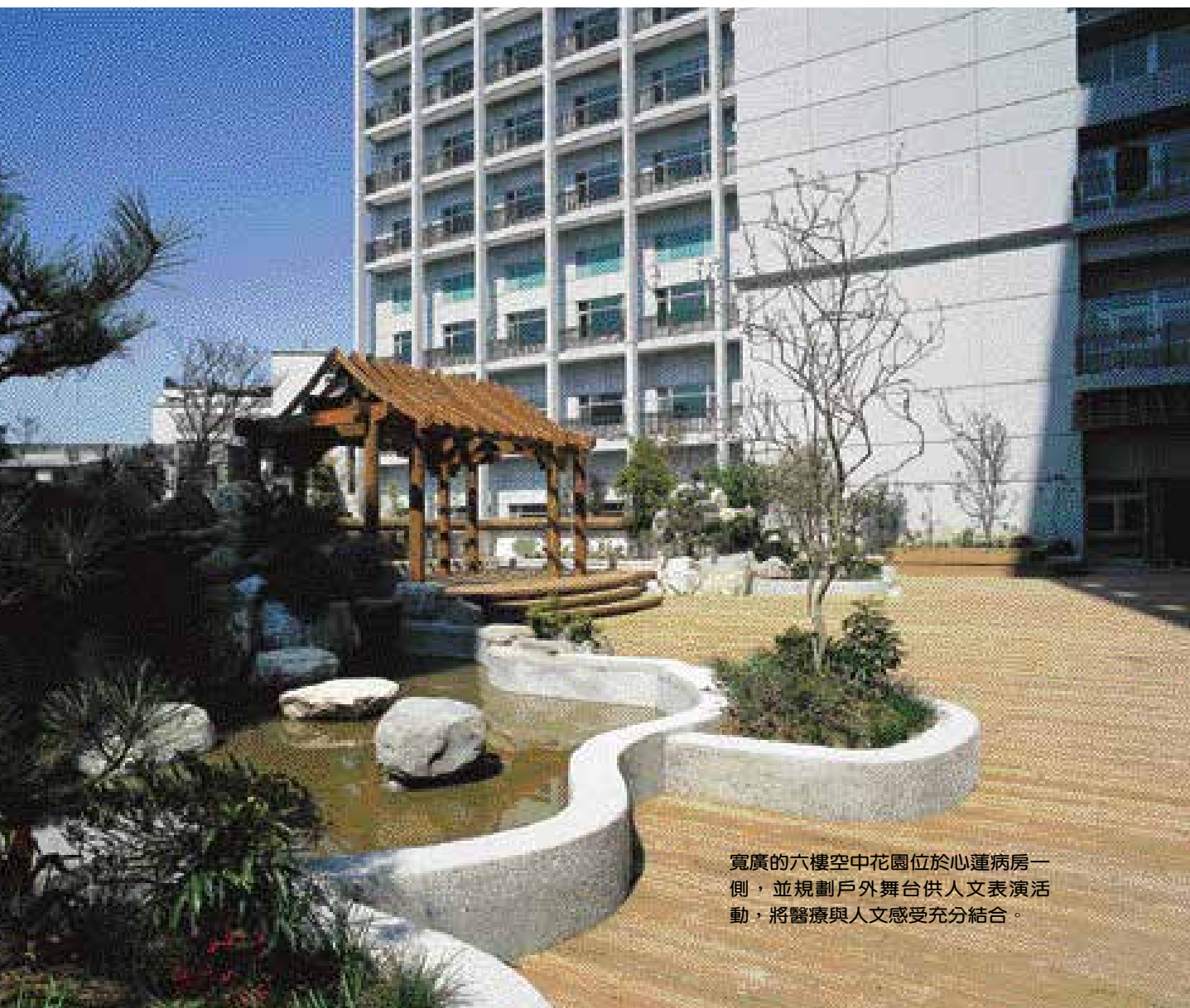
寬廣的六樓空中花園位於心蓮病房一側，並規劃戶外舞台供人文表演活動，將醫療與人文感受充分結合。

囿於篇幅，於此介紹兩位慈濟「新生」、兩位「舊生」接觸、投入新店慈濟醫院建院的感受、心得。