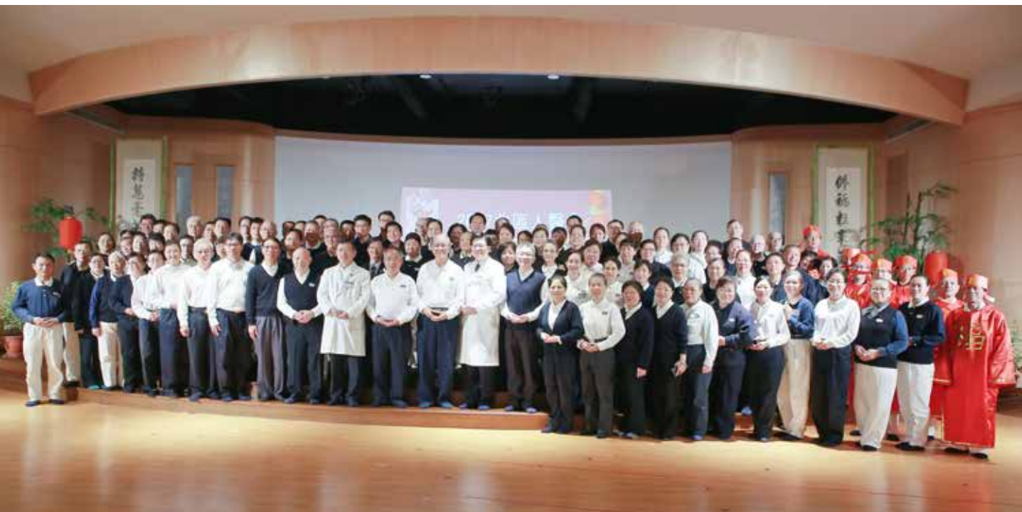
北區人醫會成員發願付出更多的醫療專業、關懷與愛。

在「秉持佛心拔病苦，恆念師志為眾生，金雞報喜迎新春，智慧雙運信願行。」的呼聲中，人醫會成員們拍下溫馨大合照。這分彼此聯繫的情誼，與共同為苦難眾生付出醫療專業的用心，將隨著人醫典範的帶動，持續在全球各個角落發光發熱，付出更多關懷與愛。🕊