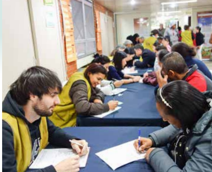
巴西聯絡處二十四周年慶義診，本土志工協助求診民眾填寫掛號單。