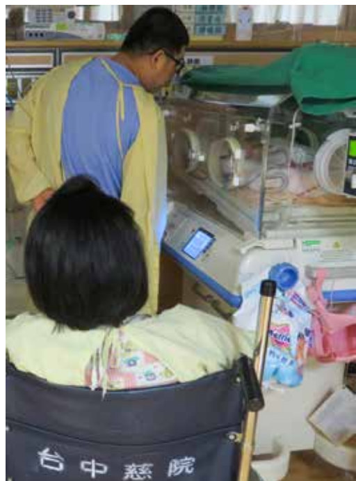
許姓媽媽在先生的陪伴下，探視待在保溫箱裡的女兒。