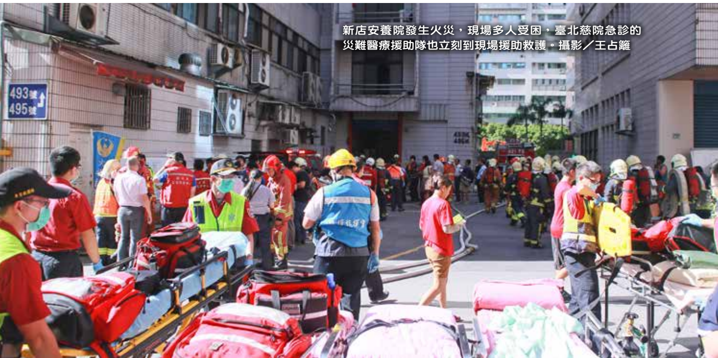
新店安養院發生火災，現場多人受困，臺北慈院急診的災難醫療援助隊也立刻到現場援助救護。

本次火災總計有七位傷者送至臺北慈院，年齡介於六十歲到九十歲之間。第一位女性傷患於上午七點三十八分