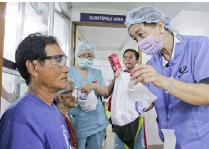
手術結束後，人醫會醫護人員給予病患藥品，並提醒使用注意事項。