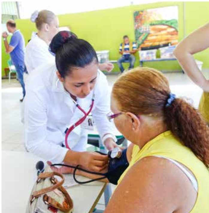
依達瓜給歇都巴市護士學校學生協助量血壓、驗血糖。