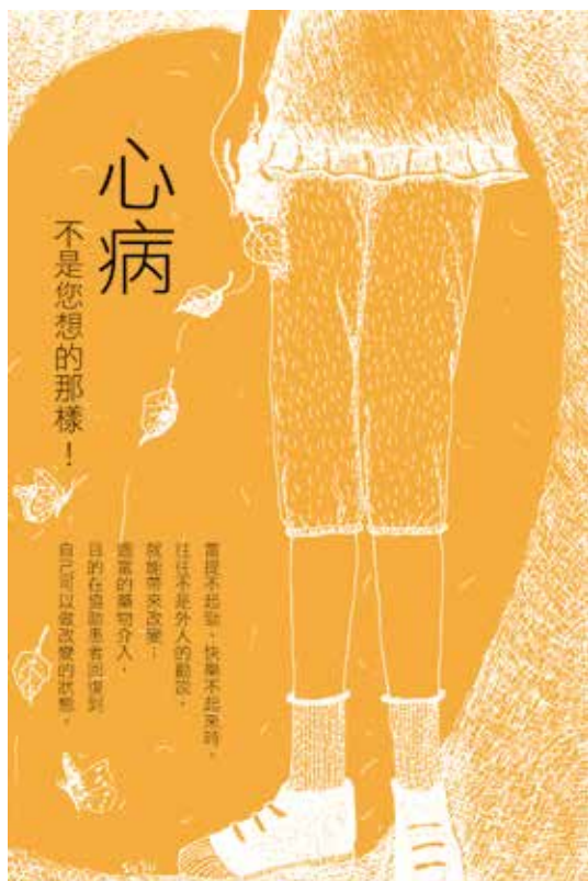
摘自《心病，不是您想的那樣！》慈濟道侶叢書