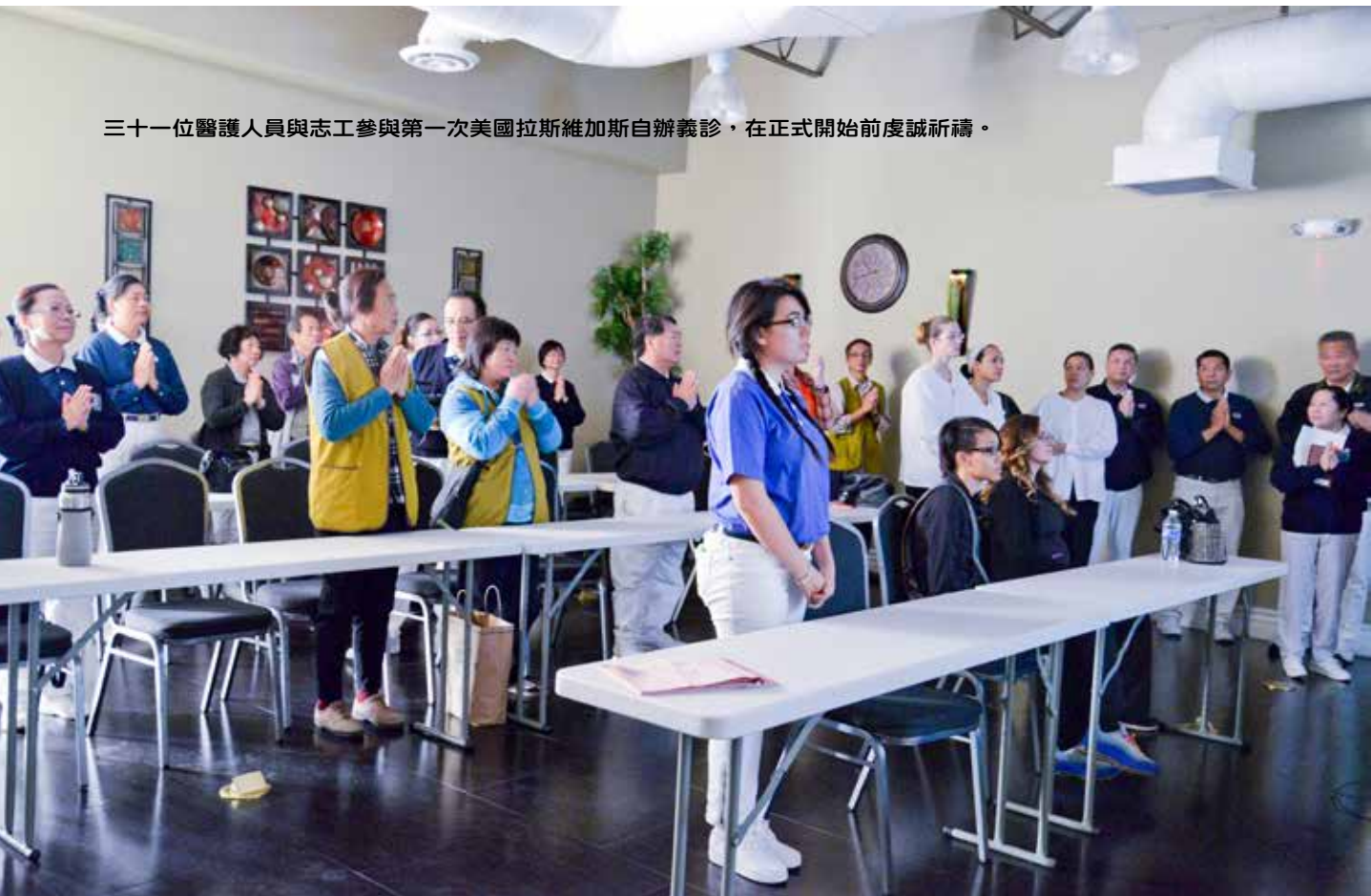
三十一位醫護人員與志工參與第一次美國拉斯維加斯自辦義診，在正式開始前虔誠祈禱。

因為是第一次辦義診，剛開始的情況有點紊亂，一個半小時後慢慢就序，流程逐漸順暢，重要的是志工從