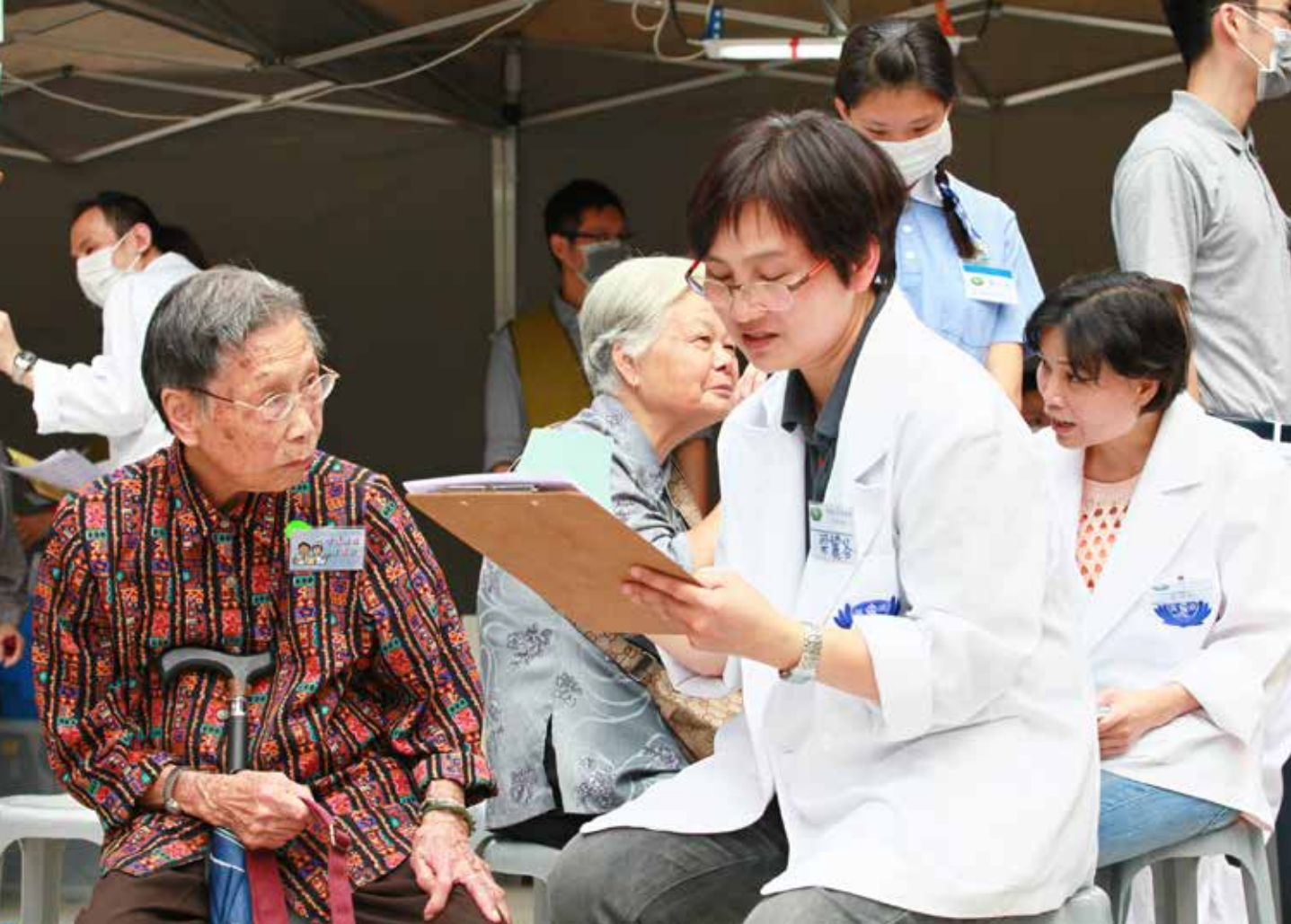
志工在義檢現場設置問卷調查區，透過了解長者們的飲食起居和生活習慣來宣導「預防勝於治療」。

科醫師李琬微察覺到，大部分的老人家主要是眼睛模糊不清和白內障、流眼淚的情況居多。李醫師說，「老人家眼淚分泌不足夠，幫他滴一些人工眼藥水滋潤一下，就不會那麼乾燥；而白內障病人則需要寫證明信件，讓他們到政府的大醫院去治療或者進行手術。」老人家都說鄉下話，李醫師會用一些圖像來解釋給他們聽，希望他們明白病情、提早治療。