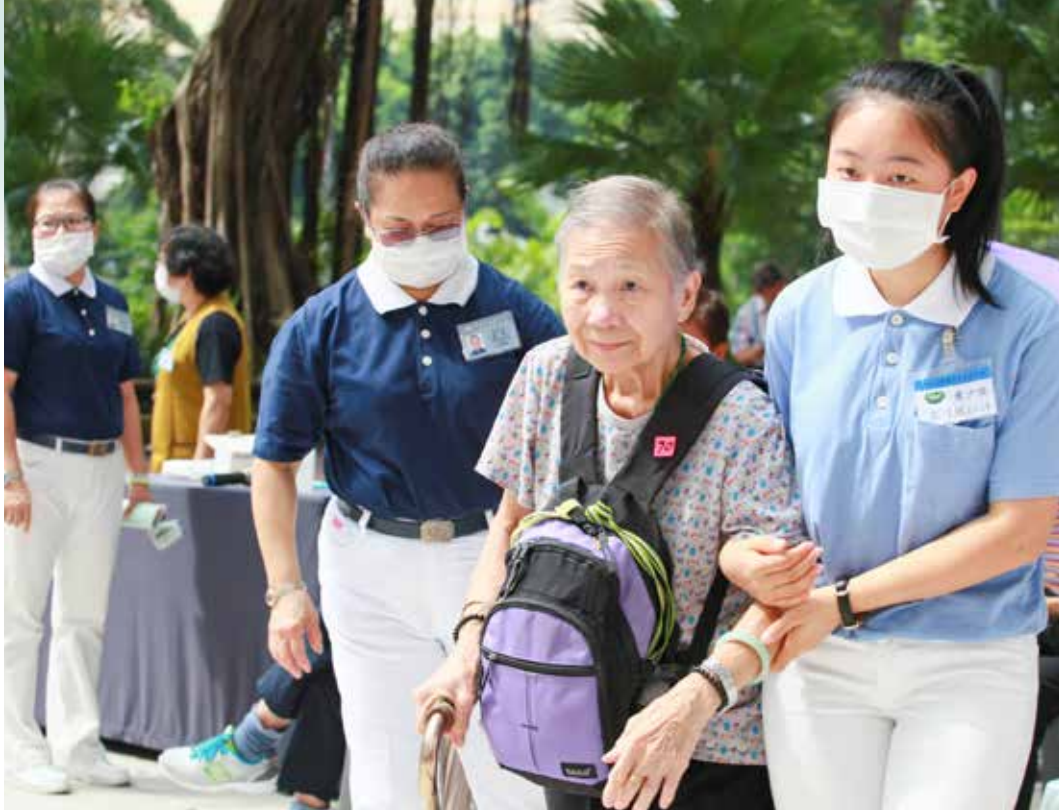
慈少班的同學（右一）也加入義檢服務的行列，他們負責接待與陪伴長輩。

在這裡深耕發展。」負責統籌活動的人醫幹事邱雅雯說起義檢的因緣。牛頭角區居住的多半是年邁或獨居的老人家，慈濟志工從二〇一一年開始深耕社區，帶動老有所用。二〇一四年十月二十六日，香港人醫會首次在牛頭角區舉辦免費健檢，提供居民多方面的保健常識。