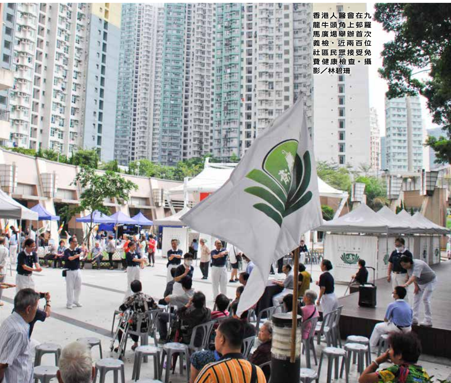
香港人醫會在九龍牛頭角上邨羅馬廣場舉辦首次義檢，近兩百位社區民眾接受免費健康檢查。

「這裡是九龍東志工深耕的社區，舉辦過環保、慈善、浴佛、祈福會等活動，現在有醫療進入，慈濟四大志業