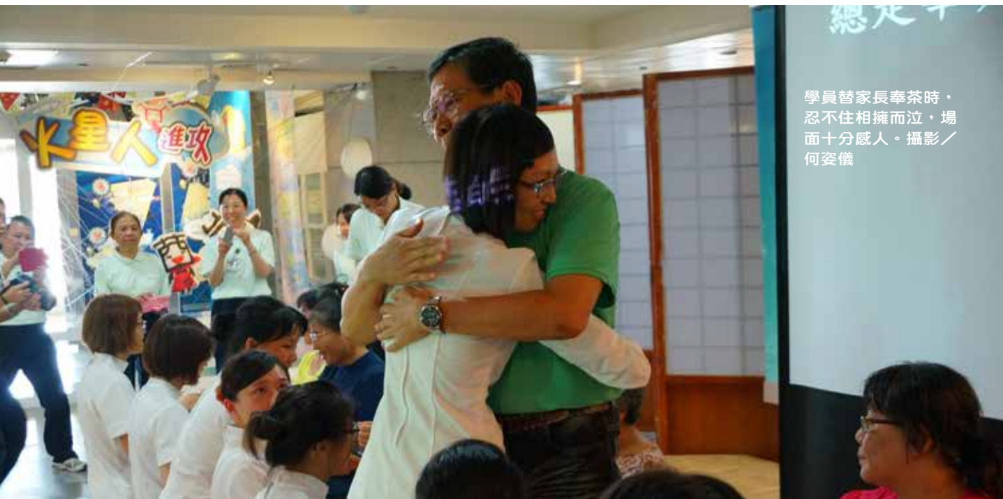
學員替家長奉茶時，忍不住相擁而泣，場面十分感人。

護理部黃雪莉主任表示，每次看到新人加入都很開心，感謝大家從學校畢業後願意踏入職場，因為每年雖然有許多畢業生，但真正進入醫院的只有約六成。她說來到醫院最辛苦是前面三個月，除了要學習與適應新環境，和實習時照顧的病人量也不同，也許壓力很大，但熟悉後就不會太困難，期待大家把醫院當福田，一起耕種結好緣。（文／謝明芳、何姿儀）