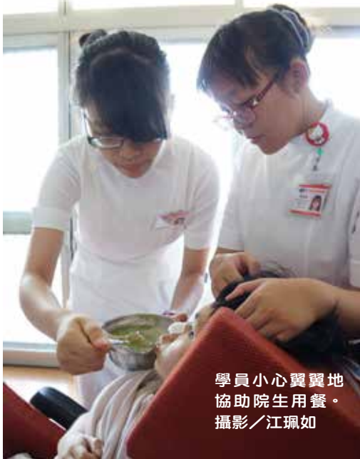
學員小心翼翼地協助院生用餐。