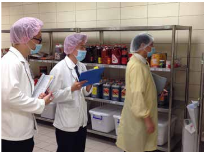
審查委員仔細走訪員工餐廳與紙本審查，最後臺中慈院員工餐廳以零缺失通過「ISO22000」認證。