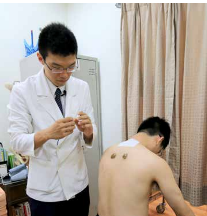
中醫師在頸椎上的大椎穴以及肩胛骨之間的定喘穴敷貼，藥材可在穴位上停留約三小時以達到最好功效。