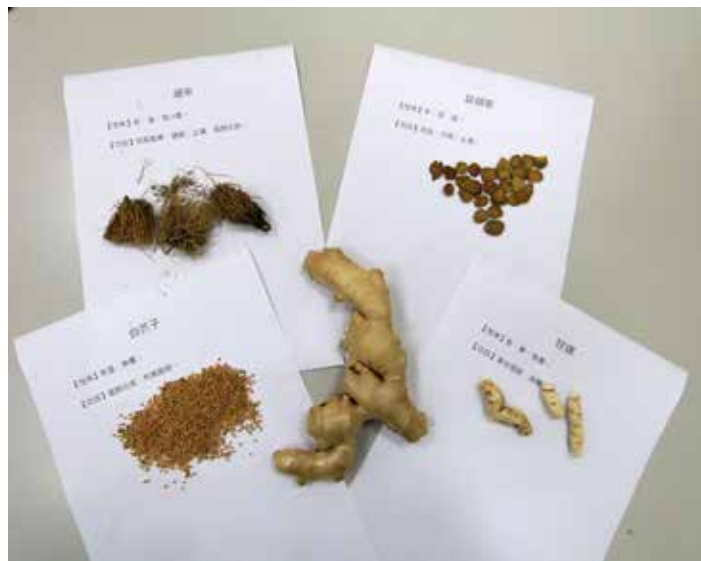
細辛、延胡索、甘遂、白芥子與薑等熱性藥材依照比例混合後，可以在三伏天敷貼於穴位上，對呼吸系統有幫助。

之中藥餅敷貼於患者背部之穴位，能疏通經絡，調節臟腑，達到扶正祛邪的功效。若能每年初、中、末伏三次，連續敷貼三年，就可助長陽氣，可作為預防及治療冬天好發的呼吸系統疾病，以減少寒冬發病率。