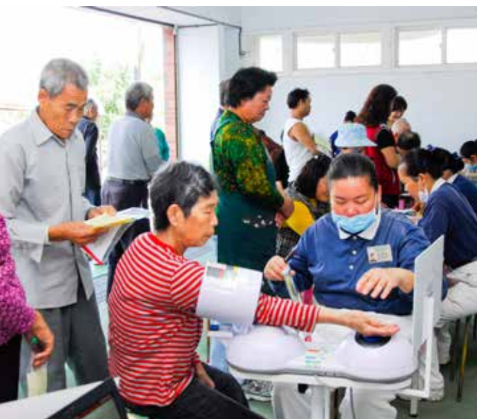
大林慈院十二年持續不斷地複合式篩檢，共服務了超過三十一萬位民眾，幫助五千五百多個民眾即時找回健康。

醫療是守護人類健康的志業，但對環境而言卻有著高耗能、高污染的特性。唯有大地健康，人們才能安然賴以為生。二〇〇八年大林慈濟醫院首度在國際研討會中發表環境健康促進議題，獲得國際認同。二〇〇九年，健康促進醫院國際網絡 (HPH) 秘書處決議，由臺灣主導推動「健康促進醫院與環境友善國際委員會」，並成功於二〇一〇年的第十八屆會員大會中提案與獲准成立，由國民健康署邱淑媿署長擔任第一任主席。過去四年努力結合健康促進醫院國際網路、國際無害醫療組織 (Health Care Without Harm, 簡稱 HCWH) 及臺灣醫界之力量，幫助醫療機構從環境污