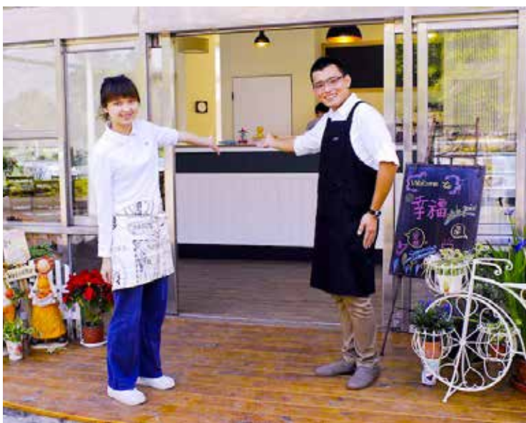
大林慈院的健康促進從身體、環境落實到心靈層面，幸福咖啡館提供同仁放鬆、感到幸福的環境。

再者，收集各國低碳醫院實施內容與資訊，進行國內或國際間綠色醫院案例報告，鼓勵會員醫院提供優良範例分享；第三為希望超越過去僅針對軟硬體設施改良減碳，將進一步結合慈濟素食人文的推廣，強化植物性飲食 (Plant-based food) 對減緩地球暖化的助益；最後，國際醫院聯盟 (International Hospital Federation, IHF) 第四十一屆世界醫院大會將於二〇一七年在臺灣舉辦，希望屆時爭取將環境友善醫院議題納於大會中，並製作文宣或影片，藉此提升醫療環境友善議題的重要性及此委員會的知名度。期能結合慈濟基金會長期厚實的環境友善基礎，步步踏實地將友善的實務，普遍扎根於國際醫療院所中，讓醫療產業成為名符其實的健康守護者。