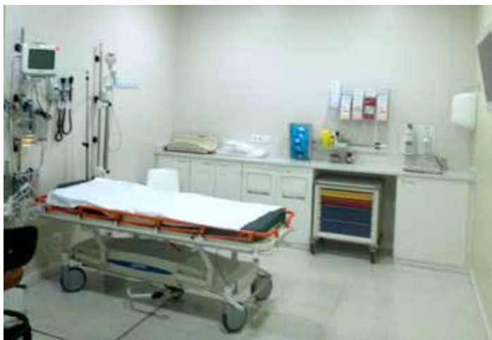
Sant Joan de Déu 是歐洲著名的兒童醫院,院內所有醫療設施都以小朋友為主體。