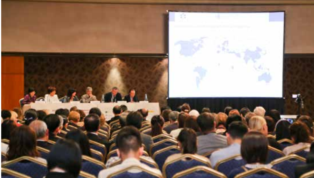
二〇一四年第二十二屆健康促進醫院國際研討會開幕式，今年共有四十二個國家共七百三十七位代表參與盛會。

體有花蓮慈院、臺北慈院、大林慈院、臺中慈院及玉里慈院都參加，共獲錄取七十九篇論文，數量約占全臺灣四分之一，創下歷年慈濟醫療志業體參與健康促進醫院國際研討會以來，最多論文發表數以及國外與會最多參與者的紀錄。其中因全球老人化，老人健康問題備受矚目。玉里慈濟醫院由健康促進專員陳世淵報告了全臺首設提供給老人與農民服務的「晨間門診」，因為對就醫長者來說，清晨門診不僅可縮短門診等候時間，病患對醫院內的其他服務滿意度也有顯著提升。另外受國際關注的「世紀之疾」失智症，根據世界衛生組織報告，全球失智人口在二〇一〇年有三千五百六十萬人，每年增加七百七十萬人。大林慈院結合神經科、家庭醫學科、老人醫學科、臨床心理師、個管師、護理師、社工師、醫療志工及人文行政同仁、大學教授等在二〇一二年九月成立雲嘉第一個失智症團隊運作，因此這次國際研討會由大林慈院失智症團隊以投入失智篩檢照護兩年以來的三篇文章不但皆獲得入選，其中一篇還被列為本