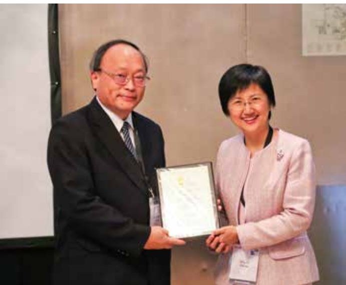
大林慈院從國內外三十三家醫院中脫穎而出，獲得「國際低碳醫院團隊合作最佳案例獎」，由剛交接卸任的 HPH 國際網路主席、臺灣國民健康署署長邱淑媿頒獎。