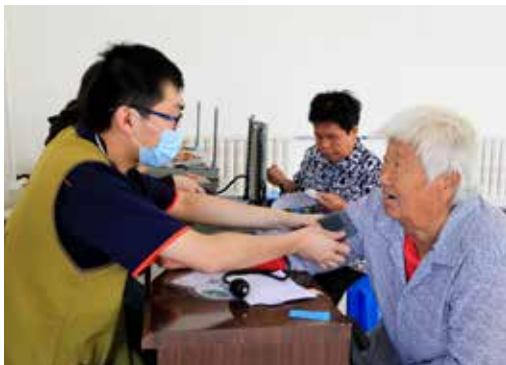
北京中醫藥大學的學生（左）為看診民眾量測血壓。