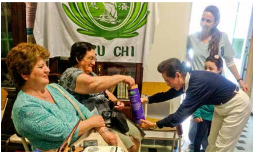
民眾將善款投入竹筒內，響應「一人一菩薩」的精神。