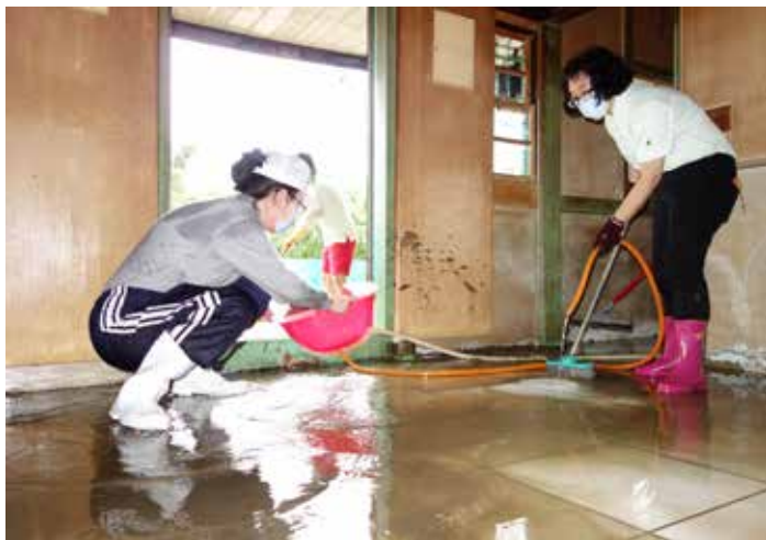
■ 眾人合力為受災戶清理家園。