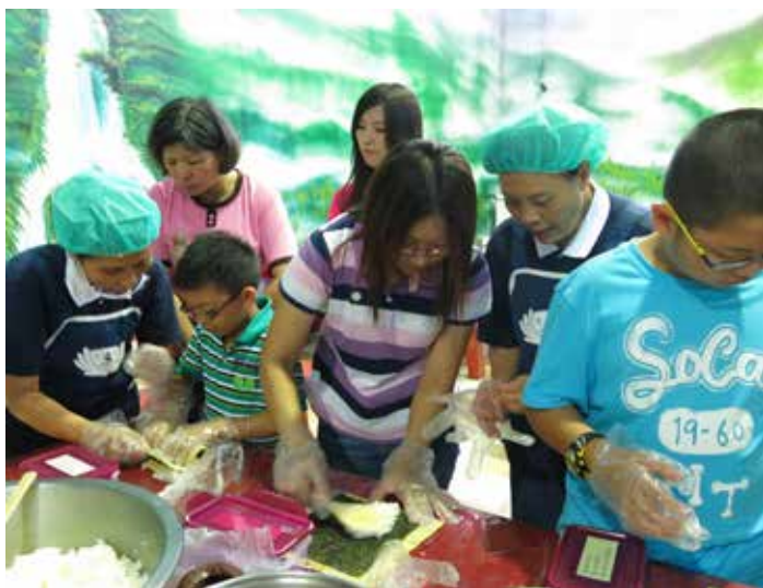
■ 志工指導民眾動手做美味的素食壽司

得拿捏力道，捲到一半食材就「崩」了，有些人則是架式十足，捲得很專業，但刀工七零八落，等到切片裝盒時，食材就全部掉了出來，讓一旁的媽媽好氣又笑，直說「土石流了！」