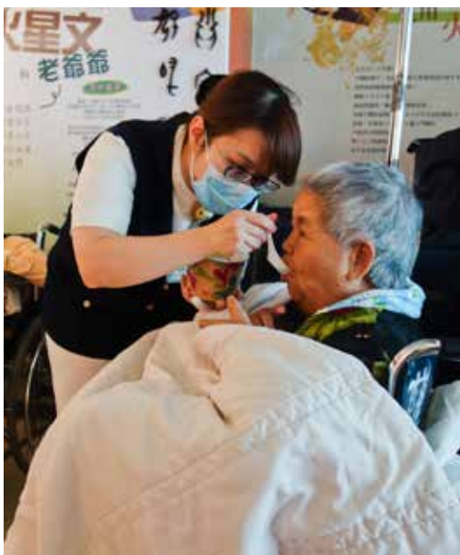
■ 護理人員親切地餵長者吃熱騰騰的鹹粥。