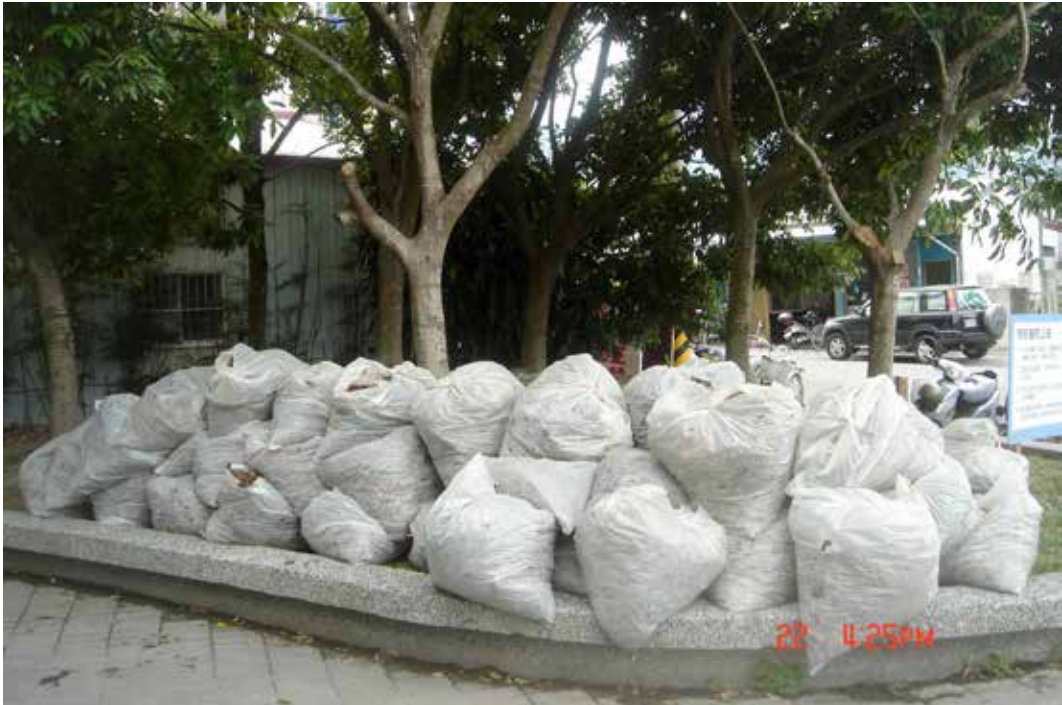
■ 總計清掃出近三十包的落葉及廢棄物，場面十分壯觀。