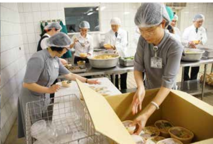
■ 醫院同仁合力打包，準備將熱騰騰的飯菜送往災區。

長者的身體狀況，所以從安養院撤離的人員會先送至急診，由醫護人員進行檢查，確認沒有問題後才會送到感恩樓一樓大廳安置。面對大量的病人湧入，部分人力又因受困路上而無法抵達醫院，