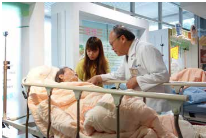
■ 賴寧生院長細心關懷長者與家屬。