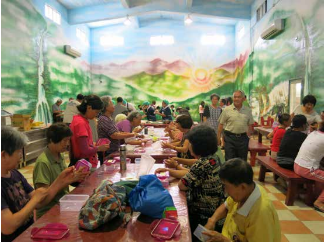
■ 民眾踴躍前來參加活動，會場幾乎座無虛席。

機和民眾分享包出漂亮壽司的訣竅與吃素的好處，她表示不只有肉類可以補充蛋白質，像這次為大家準備的食材，紅蘿蔔、小黃瓜、素香鬆、蛋皮等等都是很好的營養來源，也是健康無負擔的食物。